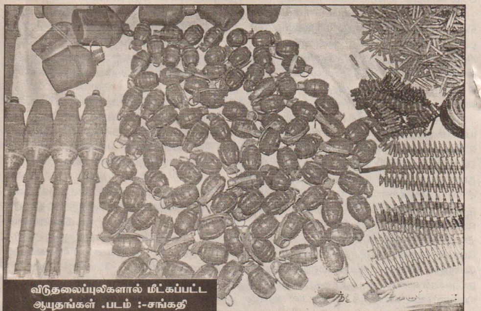
விடுதலைப் புலிகளால் மீட்கப்பட்ட ஆயுதங்கள் .

உண்மையில் புலிகள் இந்தத் தாக்குதலில் குறைந்த இழப்புடன் படையினருக்கு அதிக சேதங்களை ஏற்படுத்தியுள்ளனர். புலிகள் பலவீனமாக இருப்பதாகவும் அவர்கள் குறைந்தளவு எதிர்ப்பையே காண்பிப்பார்கள் என்றும் போட்டகணக்கு தப்பாகிவிட்டது.