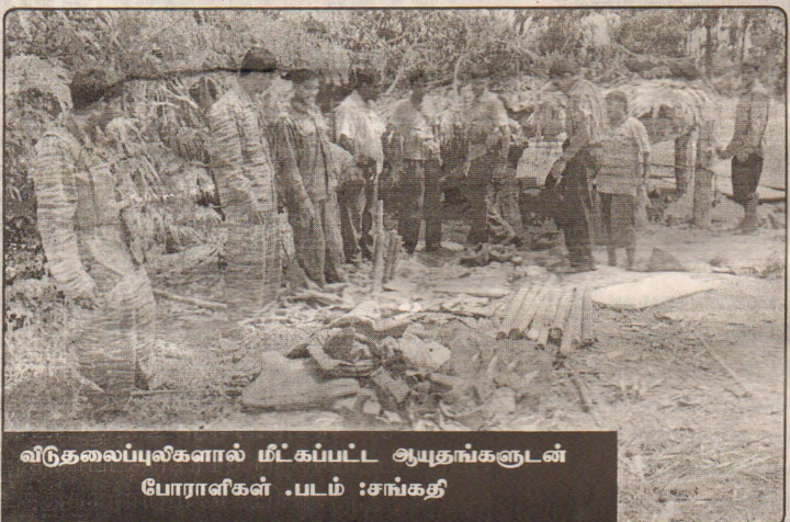
விடுதலைப் புலிகளால் மீட்கப்பட்ட ஆயுதங்களுடன் போராளிகள் .

கள் நிறைந்திருந்தன. இவற்றை அகற்ற இராணுவத்தின் பொறியியல் பிரிவு பெங்களூர் டொபிடோக்களைப் பயன்படுத்தியது. இரகசியமாக முன்னேறிய படையினர் அதிகாலை 5 மணியளவில் நேரடித் தாக்குதலைத் தொடங்கினர். குடாநாட்டின் முக்கிய ஆட்டிலரி நிலைகளில் இருந்து சமநேரத்தில் பளை, இயக்கச்சி, பூநகரி பிரதேசங்களை இலக்கு வைத்து வெடிகள் ஏவப்பட்டன. பல்சூழல் பிரங்கிகளும், கனரக மோட்டார்களும் செறிவான குட்டாதரவை வழங்கின. படையினர் முன்னகரத் தொடங்கி, பொழுது விடிவதற்குள்ளாகவே புலிகளின் முன்னரங்க நிலைகள் படையினரின் கைகளில் வீழ்ந்தன. ஆனால் துருப்புக்களுக்கு ஆச்சரியம் என்னவென்றால் அங்கு புலிகள் எவரும் இருக்கவில்லை. இதனால் புலிகளை வளைத்துப்