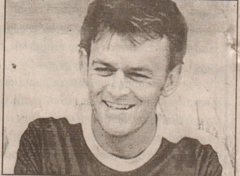
அணிக்காக விளையாடுவதில் மகிழ்ச்சி அடைகிறேன் என்றார். (அ-5)

குறித்து கில் கிறீஸ்ட் கூறுகையில், இது எனக்கு கிடைத்த அரிய கௌரவம். அவுஸ்திரேலிய