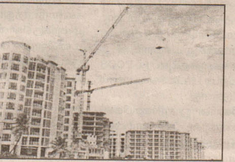
கட்டுமான நிறுவனம் உரிய அனுமதியையும் பெறவில்லை என்பது அவரது கோபத்திற்கு கூடுதல் காரணம். (அ-5)