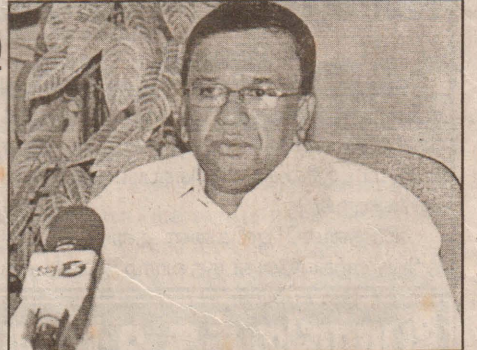
ஈழத்தமிழர் போராட்டம் என வரும்போது உணர்வால் ஒன்றுபட்டே நிற்கிறார்கள்.

பதில்: தமிழகத்திலுள்ள பல்வேறுபட்ட அரசியல் கட்சிகள் எங்களை ஆதரிக்கின்றன. எங்களைப் பொறுத்தவரை தமிழகத்தின் ஆற்றைக் கோடி மக்களும் எமது ஈழ விடுதலைப் போரின்பால் அக்கறையும் ஆதரவும் கொண்டவர்களாகவே இருக்கின்றனர். எவ்வளவுதான் கருத்து வேறுபாடு இருந்தாலும்