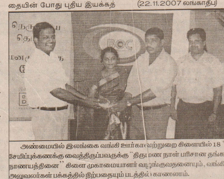
அண்மையில் இலங்கை வங்கி ஊர்காவுற்றுறை கிளையில் 18 சேமிப்புக்கணக்கு வைத்திருப்பவருக்கு "திருநாண நான் பரிசான தங்க நாணயத்தின்" கிளை முகாமையாளர் வழங்குவதையும், வங்கி அலுவலர்கள் பக்கத்தில் நிற்பதையும் படத்தில் காணலாம்.

கிழக்கு மாகாணத்தில் இயங்கி வரும் தமிழ் இயக்கங்களை ஒன்றிணைத்து புதிய இயக்கமொன்றை உருவாக்க தமிழ் மக்கள் விடுதலைப்புலிகள் இயக்கம் தீர்மானித்துள்ளது. மட்டக்களப்பு பிரதேசத்தில் கடந்த (20 ஆம் திகதி) இடம் பெற்ற கூட்டமொன்றின் போதே மேற்படி இயக்கத்தால் இத் தீர்மானம் எடுக்கப்பட்டுள்ளது. ஈ.பி.டி.பி., ரெலோ, புளொட் மற்றும் ஈ.பி.ஆர். எல். எப் போன்ற இயக்கங்களின் கிழக்கு மாகாணத்தலைவர்களை வெகுவினையில் அழைத்து இப்புதிய இயக்கம் தொடர்பான பேச்சுவார்த்தையினை மேற்கொள்ளப் போவதாகவும் அப்பேச்சுவார்த்தையின் போது புதிய இயக்கத்தின் நோக்கம் மற்றும் கொள்கைகள் பற்றி கலந்துரையாடி தீர்மானம் எடுக்கப்படவுள்ளதாகவும் தமிழ் மக்கள் விடுதலைப்புலிகள் இயக்கத்தின் பேச்சாளர் ஒருவர் தெரிவித்தார். இப்புதிய இயக்கம் தொடர்பான நடவடிக்கைகள் சாதகமாக அமையுமாயின் மேற்படி இயக்கங்களின் தலைவர்களுடன் பேச்சுவார்த்தை நடத்துவதாகவும் அவர்களின் ஒத்துழைப்பு மூலம் புதிய இயக்கத்தை அபிவிருத்தி செய்வதாகவும் மேற்படி தமிழ் மக்கள் விடுதலைப்புலிகள் இயக்கத்தின் பேச்சாளர் மேலும் தெரிவித்தார். (22.11.2007 லங்காத்தீப)