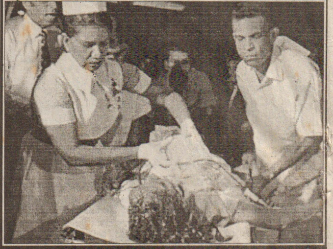
நுகேகொடவில் நேற்று மாலை குண்டு வெடிப்புச் சம்பவம் இடம்பெற்ற இடத்தில் பொலிஸார் குவிக்கப்பட்டு தேதேல் மேற்கொள்ளப்படுவதையும் தாக்குதலில் காயமடைந்த சிறுமி ஒருவர் வைத்தியசாலைக்கு எடுத்துச் செல்லப்படுவதையும் படங்களில் காணலாம்.