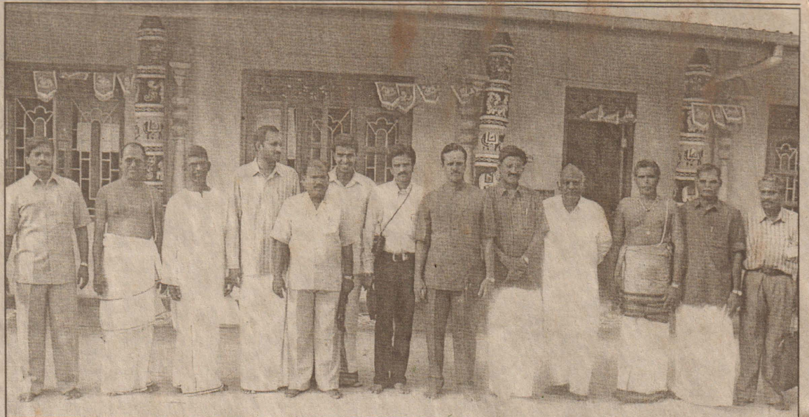
2 ஆவது உலக இந்து பிராந்திய மாநாட்டுக்காக, யாழ்ப்பாணம் வருகைதந்த தமிழக அறிஞர்கள், நல்லை ஆதீனத்தின் வாயிலில் எடுத்துக்கொண்ட படம்.