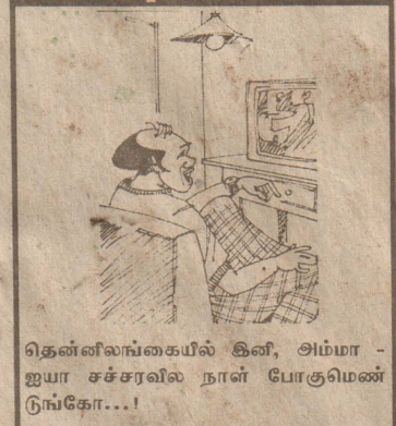
தென்னிலங்கையில் கிளி, அம்மா - ஐயா சச்சரவில் நாள் போகுமென்ற கோ...!