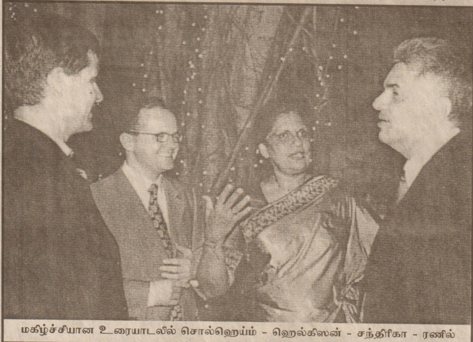
மகிழ்ச்சியான உரையாடலில் சொல்லெறும் - ஹெல்கீலன் - சந்திரிகா - ரணில்

கூடப் பெரிதுபடுத்தி, சவரொட்டிகளை ஓட்டி வருகிறது எனச் சிங்கள மக்கள் மத்தியில்