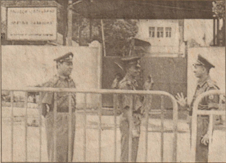
நேற்றுமுன்தினம் நள்ளிரவுவேளைமுதல் அரசாங்கத்தினால் முடப்பட்டிருக்கக்கூடும் அரசு அச்சகக் கூட்டுத்தாபனத்துக்கு முன்னால் பொலிஸார் பாதுகாப்பில்.

மலர் : 01 திருவள்ளூர் ஆண்டு: 2034 சித்திரை 28 ஆம் நாள், ஹிஜ்ரி 1425 ர.அவ்வல் 08 (11.05.2003) ஞாயிற்றுக்கிழமை இதழ் : 219