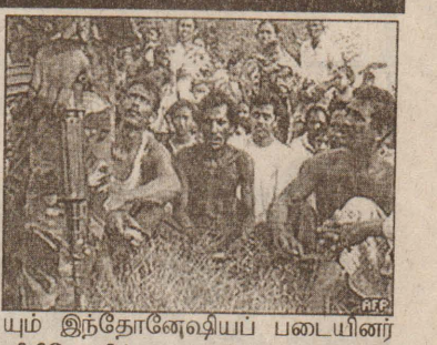
யும் இந்தோனேஷியப் படையினர் விநியோகித்து வருகின்றனர். போராளிகள் - மக்களின் பழைய அடையாள அட்டைகளைப் உபயோகிப்பதால், புதிய அடையாள அட்டைகளை வழங்க இந்தோனேஷிய பாதுகாப்பு அமைச்சு முடிவு செய்துள்ளது.

அனுமதித்துள்ளனர். உணவு, சுகாதாரப் பிரச்சினைகளால் பெருமளவு மக்கள் - குறிப்பாக, அசே குழந்தைகள் பாதிக்கப்பட்டுள்ளதாக ஐ.நா தெரிவித்துள்ளது. கிராமங்களில் இருந்து இளைஞர்கள் தப்பியோடிவிட்ட நிலையில் - எஞ்சியுள்ளவர்களை, இந்தோனேஷியப் படைகள் மிருகத்தனமாகத் தாக்கி வருகின்றனர். உறக்கத்தில் இருக்கும் கிராமத்தவர்களையும்,