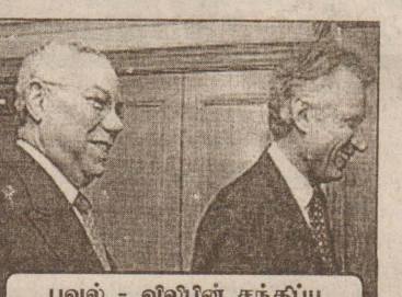
பவல் - விலிபின் சந்திப்பு

ஈராக் போர் தொடர்பாக, கருத்து முரண்பட்டுக் கொண்ட அமெரிக்காவும் பிரான்சும் தமது முரண்பாட்டை, தற்போது ஆரம்பித்துள்ள ஜி-8