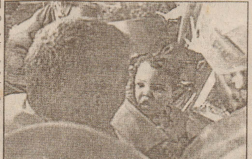
மீட்கப்பட்ட ஒருவயதுக் குழந்தை

அல்ஜீரிய பூகம்பத்தினால், பிரதான வீதிகளும் பாதிக்கப்பட்டுள்ளதால், பூகம்பத்தால் அழிந்துள்ள அல்ஜீரியப் பகுதிகளுக்கு, மீட்புப்படைகளும், கனரக வாகனங்களும், உறவினர்களும் செல்வது தாமதமடைந்து வருகின்றது. இப்பூகம்பத்தினால் இதுவரை 1600 பேர் இறந்துள்ளதாக அறிவிக்கப்பட்டுள்ளது.