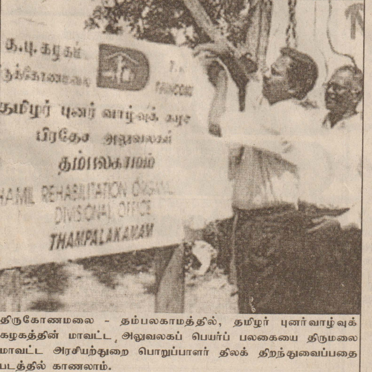
திருகோணமலை - தம்பலகாமத்தில், தமிழர் புனர்வாழ்வுக் கழகத்தின் மாவட்ட அலுவலகப் பெயர்ப் பலகையை திருமலை மாவட்ட அரசியல்துறை பொறுப்பாளர் தலக் திறந்துவைப்பதை படத்தில் காணலாம்.

தொலைத்தொடர்பு மறுசீரமைப்பு ஆணைக்குழு ஆகியவற்றைச் சேர்ந்த அதிகாரிகள் இடம்பெற்றுள்ளனர். இந்தக் குழுவின் பாவனையில் இல்லாத, அழிவுற்ற கோபுரங்கள் குறித்தும் ஆராயவுள்ளதாகத் தெரிய வருகிறது.