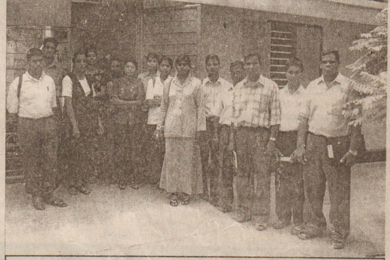
'நமது ஈழநாடு' பத்திரிகை நிறுவனத்திற்கு யாழ்ப்பாணம் பல்கலைக்கழக சமுதாய மருத்துவத்துறை மாணவர்கள் தமது கற்றல் நடவடிக்கைக்காக வருகை தந்தபோது எடுக்கப்பட்ட படம்.