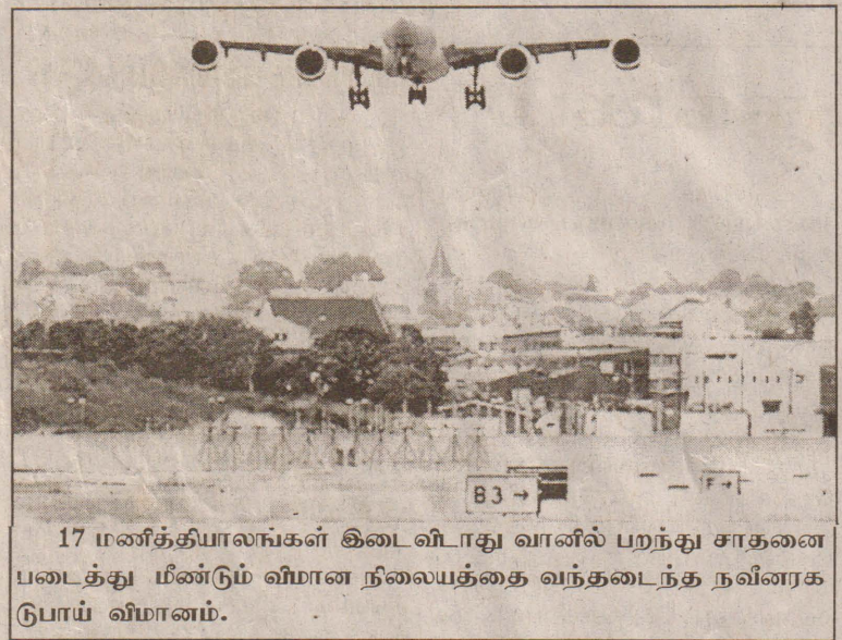
17 மணித்தியாலங்கள் இடைவிடாது வானில் பறந்து சாதனை படைத்து மீண்டும் விமான நிலையத்தை வந்தடைந்த நவீனரக ரூபாய் விமானம்.

துக்குள்ளாகியுள்ளது. பிரதமர் லேஸெக் மில்லரிடமிருந்து எலும்பு முறிவு ஏற்பட்டுள்ளதால் அவர் தீவிரச் சிகிச்சைப் பிரிவில் அனுமதிக்கப்பட்டுள்ளார். இதேவேளை, அடுத்த வாரம் அயர்லாந்துக்கு விஜயமொன்றை மேற்கொள்ளவிருந்த பிரதமர் லேஸெக் தனது விஜயத்தை பிற்போட்டுள்ளார். (உ-2)