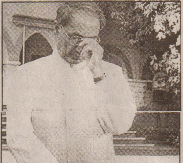
மத்தியப் பிரதேச மாநிலங்களவைத் தேர்தலில் காங்கிரஸ் படுதோல்வியடைந்ததைத் தொடர்ந்து முதல்வர் பதவியில் இருந்து விலகிய திக்விஜய் சிங் சோகமே உருவாகக் கூடாது என்கிறார்.