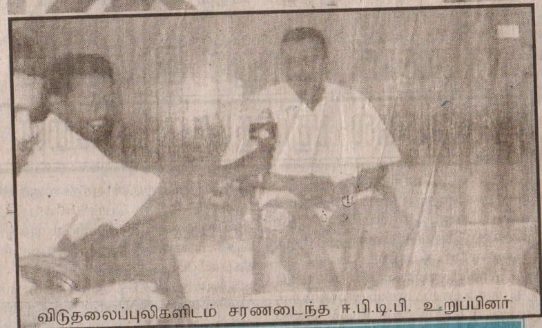
விடுதலைப்புலிகளிடம் சரணடைந்த ஈ.பி.டி.பி. உறுப்பினர்

நடுவு நிலை தவறா நன்னெறி காக்கும் உங்கள் நாளிதழ்