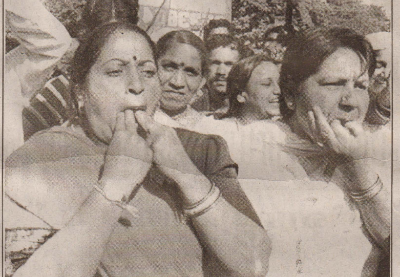
மத்தியப் பிரதேச மாநில சட்டமன்றத் தேர்தலில் மொத்தமுள்ள 230 தொகுதிகளில் சுமார் 173 தொகுதிகளை பா.ஜ.க கைப்பற்றி அமோக வெற்றியைப் பெற்றுள்ளது. முதல்வராக அக்கட்சியின் முக்கிய தலைவர் உமாபாரதி பதவியேற்கிறார். பா.ஜ.க.வின் வெற்றியை விசிலடித்துக் கொண்டாடும் பெண் ஆதரவாளர்கள்.

வழங்கப்படவுள்ள இக்கடனைத் திருப்பிச் செலுத்த பாகிஸ்தானுக்கு 10 ஆண்டுகள் அவகாசம் வழங்கப்பட்டுள்ளது. (உ-9)