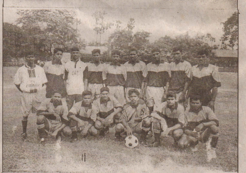
யாழ். மாவட்ட விளையாட்டுத்துறையின் ஏற்பாட்டில் இன்று மாலை 3.00மணிக்கு சன்னாகம் ஸ்கந்தவரோதயாக் கல்லூரியில் நடைபெறவுள்ள உதைபந்தாட்டப் போட்டியின் இரண்டாவது கால்இறுதிப் போட்டியில் மோதவுள்ள நாவாந்துறை சென்.மேரீஸ் விளையாட்டுக் கழகத்தின் வீரர்களையும், சென்றோக்ஸ் விளையாட்டுக் கழக வீரர்களையும் படங்களில் காணலாம்.