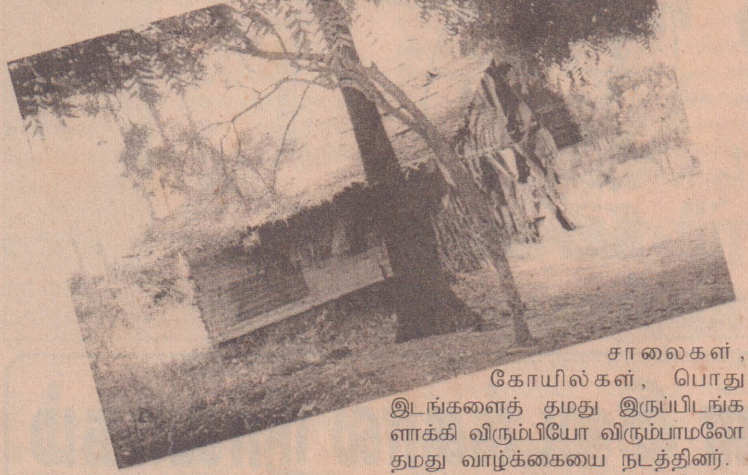
சாலைகள், கோயில்கள், பொது இடங்களைத் தமது இருப்பிடங்களாக்கி விரும்பியோ விரும்பாமலோ தமது வாழ்க்கையை நடத்தினர்.

கொடுப்பனவு, புனரமைப்புக்கான உதவு தொகை என உதவித் திட்டங்கள் நடைபெற்று வந்தாலும், இவற்றைப் பெற்றுக்கொள்ளாது- அடிப்படை வசதிகள் அற்று, அகதி என்ற பெயருடன் நலன்புரி நிலையங்களில் நோய்களைத் தமதாக்கி தமது ஆயுளை விரைவுபடுத்தும் மக்கள் இன்று எழுந்த பிரதேசங்களில் அதிக எளிலில் உள்ளனர். இவர்களின் நிலை இப்படியே தொடரத்தான் போகிறதா? இதற்கு உரியவர்கள்