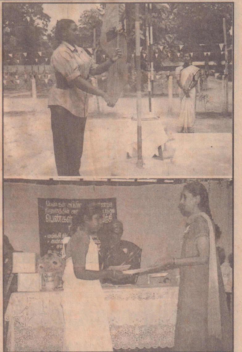
கிளிநொச்சி பெண்கள் அபிவிருத்தி புனர்வாழ்வு தொழிற்பயிற்சி நிலையத்தில் நேற்று நடைபெற்ற கண்காட்சி மற்றும் சான்றிதழ் வழங்கும் நிகழ்வில் மகளிர் அரசியல் துறைப் பொறுப்பாளர் தமிழீன் தேசியக் கொடியேற்றவைப்பதையும், பயிற்சியை நிறைவு செய்த புவதி யொருவருக்கு சான்றிதழ் வழங்கப்படுவதையும் படங்களில் காணலாம்.

இலங்கை சமுர்த்தி அதிகார சபையின் பிரதிப்பணிப்பாளரால் நடத்தப்படவுள்ள இந்தப் பயிற்சி வகுப்பில், கலந்துகொள்ளும் சமுர்த்தி அபிவிருத்தி உத்தியோகத்தர்கள் - தத்தமது பெயர் விபரங்களைப் பதிவுசெய்து கொள்ளுமாறு கேட்கப்பட்டுள்ளது.