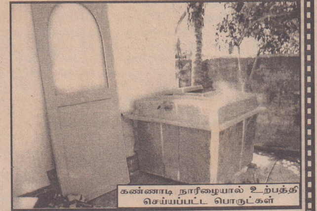
கண்ணாடி நாரிழையால் உற்பத்தி செய்யப்பட்ட பொருட்கள்

கைத்தொழிலை ஊக்குவிப்பதற்கு வெளிநாட்டு நிறுவனங்கள் கடன்உதவி வழங்கும்போது, கச்சேரி ஊடாக உதவுவதாக அரசு அதிபர் கூறியுள்ளார். எங்களுக்கு நிதி அதிகரித்து, தொழிலும் வளரும்போது, இன்னும் 10 பேருக்கு வேலைவாய்ப்பு கொடுக்கலாம். தற்சமயம் எங்களுக்கு எப்போதாவதுதான் வேலை வருகின்றது என்றார். உங்களைப்போல் முயற்சி எடுத்துத் தொழிலை ஆரம்