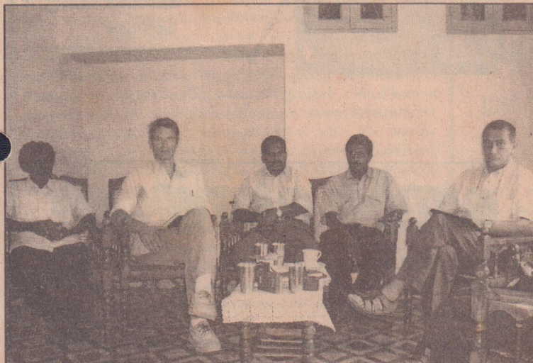
போர்நிறுத்தக் கண்காணிப்புக்குழுவின் அரசியல் ஆலோசகர் ஜியர் சியபோராவுக்கும் விடுதலைப் புலிகளின் பிரதிநிதிகளுக்கும் இடையில் யாழ்ப்பாணம் மாவட்ட அரசியல்துறை அலுவலகத்தில் நேற்றுமுன்தினம் நடைபெற்ற சந்திப்பின்போது எடுக்கப்பட்ட படம்.

பிரதமருடன், முக்கிய அமைச்சர்களான வெளியுறவுத்துறை அமைச்சர் ரிரோன் பெர்னான்டோ, விஞ்ஞான பொருளாதார மறுசீரமைப்பு அமைச்சர் மிலிந்த மொறகொட மற்றும் சமாதான செயலகத்தின் பணிப்பாளர் பேர்னாட் குணதிலக ஆகி