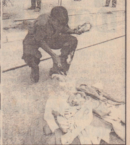
கலைக்கூடல் பதாகைகளுக்கு தீ வைப்பு