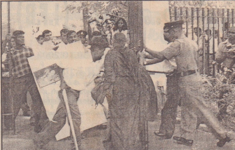
பொல்லாரையும் மீறி உள்நுழையும் சிறை உறுமய குண்டர்கள்.

மலர் : 02 திருவள்ளூர் ஆண்டு: 2034 ஐப்பசி 13 ஆம் நாள், ஹிஜ்ரி 1425 றம்ழான் 04 (30.10.2003) வியாழக்கிழமை இதழ்: 30