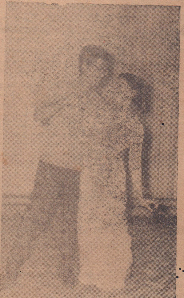
சென்ற வாரத்தில் யாழ்ப்பாணத்துல நடைபெற்ற 'எழுத்தாளன் காதலி' நாடகத்தில் ஒரு காட்சி. [விமர்சனம் 11-ம் பக்கம்]

ஊர்காவற்றுறைப் பகுதியிலுள்ள அநேக பாடசாலைகளில் பிள்ளைகள் தமது புத்தகங்களோடு தண்ணீர்ப் போத்தலையும் சமந்து செல்லவேண்டிய நிர்ப்பந்தம் ஏற்பட்டிருக்கிறது. கடும் தண்ணீர்ப் பஞ்சம் காரணமாக அப்பகுதிகளில் வீடுகளுக்குக் கூப்பனுக்குத்தான் தண்ணீர் கொடுக்கப்படுகிறது!