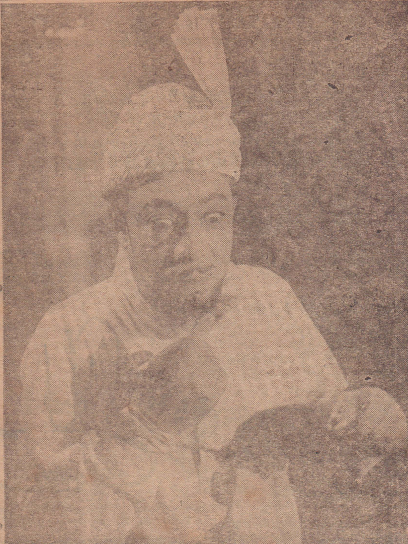
'எல்லாம் உனக்காக' படத்தில் டி. ஆர். ராமச்சந்திரன்.