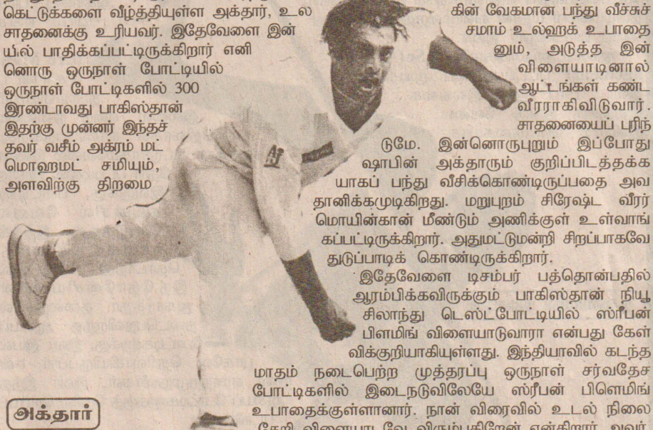
அக்தார் தேவை இவர் சேவை

நியூசிலாந்து அணை ஒருநாள் போட்டிகளில் - பாகிஸ்தான் அணி சிறப்பாகவே செயற்பட்டுக்கொண்டிருக்கிறது. இந்தநிலையில் வேகப்பந்து வீச்சாளர் சோஹெய்யப் அக்தார் தனது தடைதாண்டி அணியில் சேர்ந்து கொள்வது சமாம் உல்லறக் உபாதை கின் வேகமான பந்து வீச்சுக் கெட்டுக்களை வீழ்த்தியுள்ள அக்தார், உலக சாதனைக்கு உரியவர். இதேவேளை இன்யில் பாதிக்கப்பட்டிருக்கிறார் எனினொரு ஒருநாள் போட்டியில் 300 ஓட்டங்கள் கண்ட வீரராகிவிடுவார். சாதனையைப் புரிந்தமே. இன்னொருபுறம் இப்போது ஷாபின் அக்தாரும் குறிப்பிடத்தக்க யாகப் பந்து வீச்சிக்கொண்டிருப்பதை அவதானிக்கமுடிகிறது. மறுபுறம் சிரேஷ்ட வீரர் மொயின்கான் மீண்டும் அணிக்குள் உள்வாங்கப்பட்டிருக்கிறார். அதுமட்டுமன்றி சிறப்பாகவே துடுப்பாடிக்கொண்டிருக்கிறார்.