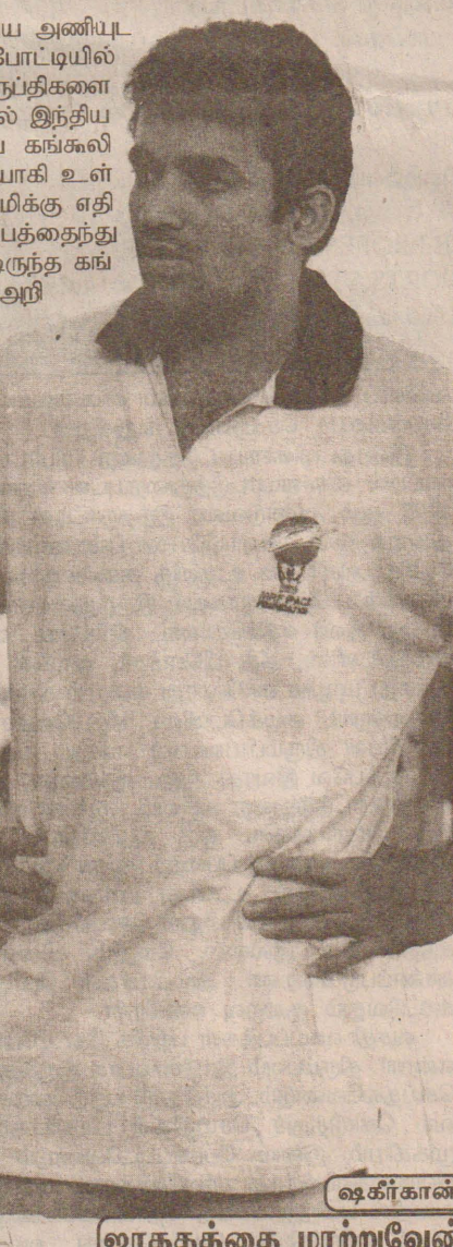
ஷகீர்கான் ஜாதகத்தை மாற்றுவேன்

இந்திய அணி அவுஸ்திரேலிய அணியுடனான முதலாவது டெஸ்ட் போட்டியில் சந்திக்கும்முன்னமே, பல அதிருப்திகளை எதிர்நோக்கியிருக்கிறது. இதில் இந்திய அணியின் தலைவர் சௌரவ் கங்கூலியின் நடத்தை கேள்விக்குறியாகி உள்ளது. குயின்ஸ்லாந்து அக்கடமிக்கு எதிரான ஒரு ஆட்டத்தில் முப்பத்தைந்து ஓட்டங்களுடன் ஆடிக்கொண்டிருந்த கங்கூலி ஆட்டம் இழந்தார் என்று அறிவிக்கப்பட்டபோது, கங்கூலி அதை ஏற்றுக்கொள்வதாக இல்லை. மைதானத்திலேயே சிறிது தாமதித்துத் தன் எதிர்ப்பைக் காட்டிய அவர், பின்னர் மைதானத்தை விட்டே வெளியேறி தான் தங்கியிருந்த ஹோட்டலுக்குச் சென்றுவிட்டாராம். இதற்கு முன்னதாகவே காலையில் தனது அணியினர் களத்தடுப்பில் ஈடுபட்டிருந்தபோது, அவர் பயிற்சியில் (NETS) ஈடுபடச் சென்று விட்டாராம். டெஸ்டுக்கு முன்னதாக இரண்டு ஆட்டங்களும் கங்கூலிக்கு வாய்ப்பாக அமையவில்லை. அவரால் சேகரிக்கக் கூடியதாக இருந்த ஓட்டங்கள் இரண்டும், ஆறும் மட்டுமே யாகும். இந்த நிலையில் தற்போது அவர் நடந்து கொண்ட முறை பெரும் அதிருப்தியை உருவாக்கி இருக்கிறது. அதிலும் சர்வதேச அணியொன்றின் தலைவர் தனது அணி மைதானத்தில் ஆடிக்கொண்டிருக்க. தனது தனிப்பட்ட பயிற்சிக்காகச் சென்றமை எப்படிச் சாத்தியமானது என்று வியப்புறுகிறார்கள் விமர்சகர்கள்.