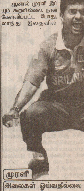
முரளி அலைகள் ஓய்வதில்லை

முரளி பற்றிய அந்தச் செய்தியை படித்தபோது, சிறிது ஆச்சரியமாகத்தான் இருந்தது. ரெய்ஸ் கொடிக், வேன், டிசர் போன்றவர்களுக்குத்தான் சில விசேஷத்த பந்துவிச்சகக் களை விசப் பயிற்சி பெற்றிருக்கிறேன். அவற்றை இந்த டெஸ்ட் தொடரில் காட்டுவேன் என்று கூறியதாகச் செய்திகள் வந்திருந்தன. உலகத் தரம்வாய்ந்த முரளி ஏன் இப்படியொரு கருத்தைத் தெரிவித்திருந்தார் என்று இவரின் ரசிகர்கள் விசனம் தெரிவித்திருந்தார்கள்.