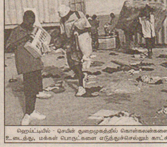
ஹெய்ட்டியில் - செயின் குறைமுகத்தில் கொள்கலன்களை உடைத்து, மக்கள் பொருட்களை எடுத்துச்செல்லும் காட்சி

(ஜோகன்னஸ்பேர்க்) தென்னாபிரிக்க ஜனாதிபதி தபோ மெபெகி தென்னாபிரிக்காவின் பொதுத்தேர்தல் ஏப்ரல் 14 ஆம் திகதி நடத்தப்படவுள்ளதாகத் தெரிவித்தார். ஆயிரக்கணக்கான தேசிய காங்கிரஸ் இந்தத் தேர்தலில் அதிகளவில்லான வாக்குப் பலத்தடன் வெல்லமுடியும் எனவும் - மக்களின் அடிப்படைத் தேவைகளான வீடு, குடிநீர் ஆகியவற்றைத் தாம் வழங்கியுள்ளதாக அவர் தெரிவித்தார். 1994 ஆம் ஆண்டு வெள்ளையர்களிடமிருந்து ஆட்சிமாறியபின்னர் நடத்தப்படும் 3 ஆவது தேர்தல் இதுவாகும். முதலில் ஜனாதிபதியாக நெல்சன் மண்டேலா தெரிவானமை குறிப்பிடத்தக்கது.