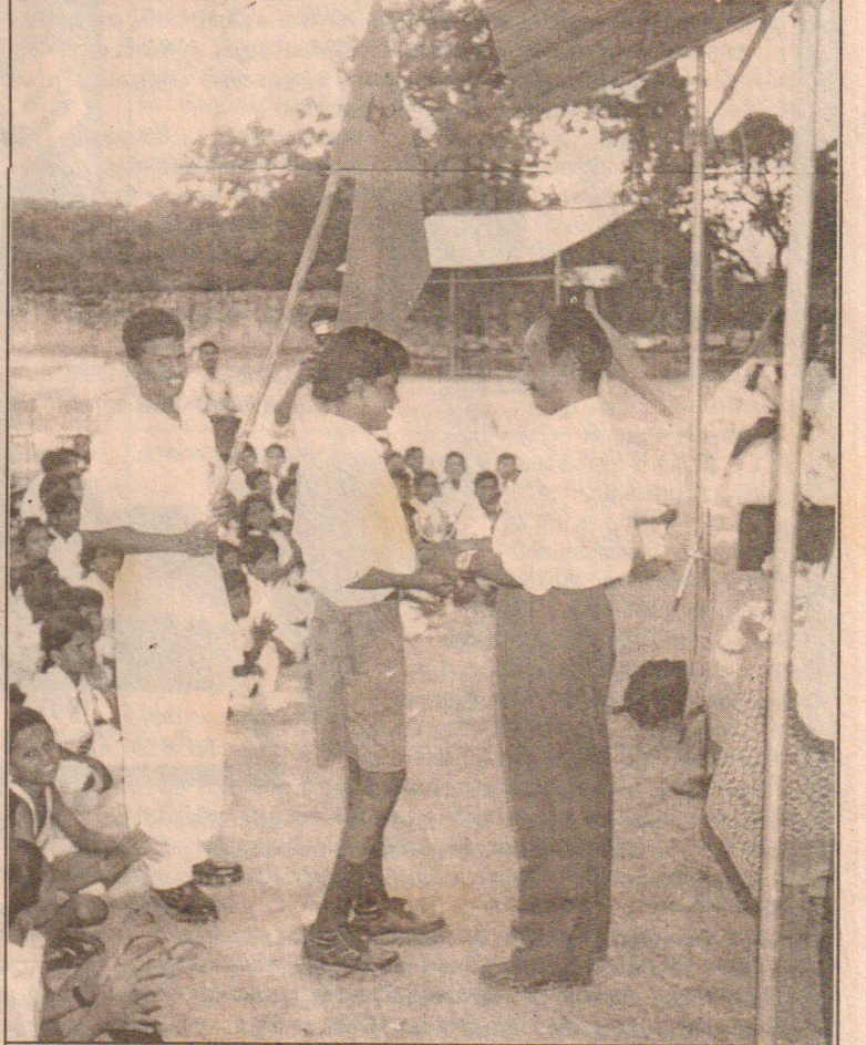
காரைநகர் சுந்தரமுர்த்தி நாயனார் வித்தியாலய கில்ல மெய்வல்லூநர் போட்டியில் வெற்றியீட்டிய மாணவன் ஒருவருக்கு பிரதம விருந்தினர் வெற்றிக் கிண்ணம் வழங்குவதைப் படத்தில் காணலாம். (91)