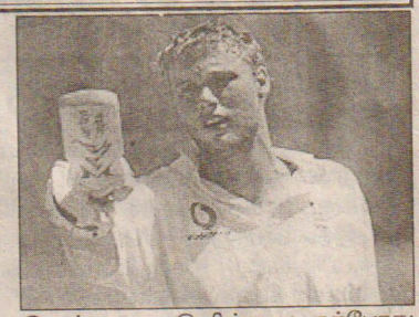
இரண்டாவது இனிங்ஸை தற்போது விளையாடி வருகின்றது. இதில் நான்காம் நாள் ஆட்ட நேர முடிவில் அந்த அணி விக்ரெட் இழப்பின்றி 145 ஓட்டங்களைப் பெற்றுள்ளது.