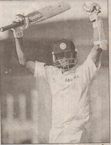
இந்திய - பாகிஸ்தான் அணிகளுக்கிடையில் ராவல்பிண்டியில் இடம்பெற்றுவரும் முன்றாவதும், இறுதியுமான டெஸ்ட் போட்டியில் இரண்டாவது நாளை நேற்று ஆட்டநேர முடிவில் இந்திய அணி 4 விக்ரெட்டுகளை இழந்து 342 ஓட்டங்களைப் பெற்றுள்ளது.

முன்னதாக முதலாம் நாள் ஆட்ட நேர முடிவில்தான் 1 விக்ரெட்டை இழந்து 23 ஓட்டங்களைப் பெற்றிருந்த இந்திய அணி நேற்றைய இரண்டாம் நாள் ஆட்டத்தில் சிறப்பாக விளையாடி இந்த ஓட்டத்தைப் பெற்றுக்கொண்டது. இதில் ஆரம்பத் தடுப்பாட்ட வீரர் பார்த்தீவ் பட்டேலுடன் இரண்டாவது விக்ரெட்டுக்காக இணைந்த ராகுல் ராவிட் ஜோடி தமக்கிடையே 129 ஓட்டங்களைப் பெற்றது. இதில் பட்டேல் 69 ஓட்டங்களுடன் ஆட்டமிழக்க அதன்பின் வந்த டெண்டுல்கரும் ஒரு ஓட்டத்தான் ஆட்டமிழந்தார். பின்னர் ராவிட்டுடன் நான்காவது விக்ரெட்டுக்காக இணைந்த லக்ஷ்மன் ஜோடி சிறப்பாக விளையாடி 129 ஓட்டங்களைப் பெற்றது. இதில் லக்ஷ்மன் 71 ஓட்டங்களைப் பெற்று ஆட்டமிழந்தார்.