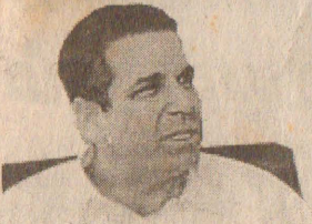
ஆயுதக் கொள்வனவில் சம்பந்தப்பட்ட செகவ்

இது தொடர்பாக இஸ்ரேலிய பாதுகாப்பு அமைச்சர் உயர் அதிகாரி ஒருவர் தகவல் வெளியிடுகையில் -