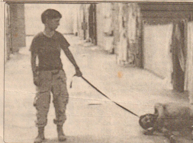
ஈராக்கிய கைதிகள் மீதான அமெரிக்கப் படையினரின் துன்புறியோகங்கள், அமெரிக்கப் பாதுகாப்புச் செயலர் டொனால்ட் ரம்ஸ் பீல்ட்

மீது அதிக அழுத்தங்களைக் கொடுத்துள்ளது. ஈராக்கிய கைதிகள் அமெரிக்க படையினரால் துன்புறுத்தப்படுவது தொடர்பாக அண்மையில் பத்திரிகையொன்றில் பிரசுரிக்கப்பட்ட புகைப்படங்கள் அமெரிக்க அதிபர் ஜோர்ஜ் புஷ்ஷிற்கும், பாதுகாப்பு செயலர் ரம்ஸ் பீல்ட்டிற்கும் இடையே முறுகல் நிலையை தோற்றுவித்துள்ளது. பி.பி.சியின் வொஷிங்டன் செய்தியாளர் கருத்துத் தெரிவிக்கும் போது, ரம்ஸ் பீல்டைப் பதவியிலிருந்து விலகுமாறு அதிபர் புஷ் நிர்ணயிக்கலாமென குறிப்பிட்டுள்ளார். அமெரிக்கப் பெண் படையினர்