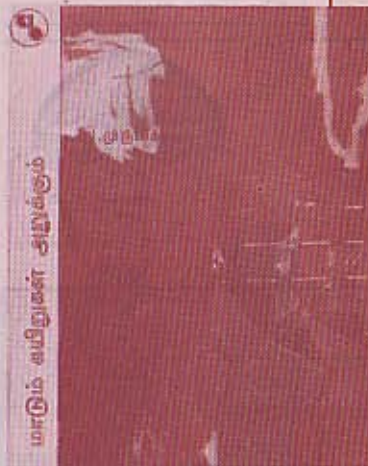
மாடும் கயிறுகள் அறுக்கும்