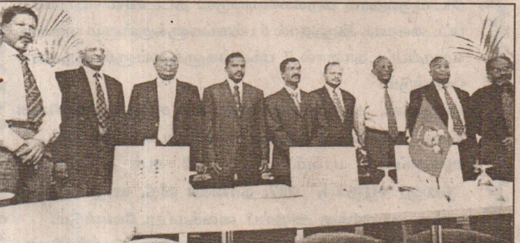
பாரிஸ் சட்ட நிபுணர்கள் மாநாட்டில் கலந்துகொள்ளும் பிரமுகர்கள்

திருகோணமலையில் பூரண ஹர்த்தால் அனுஷ்டிக்கப்படவுள்ளது. மேற்படி ஹர்த்தாலுக்கான அழைப்பு பிணை திருகோணமலை வாழ் பொங்கு தமிழ் சமூகம் விடுத்ததுள்ளது. விடுதலைப் புலிகள்தான் ஏகப் பிரதிநிதிகள். (10ம் பக்கம் பார்க்க)