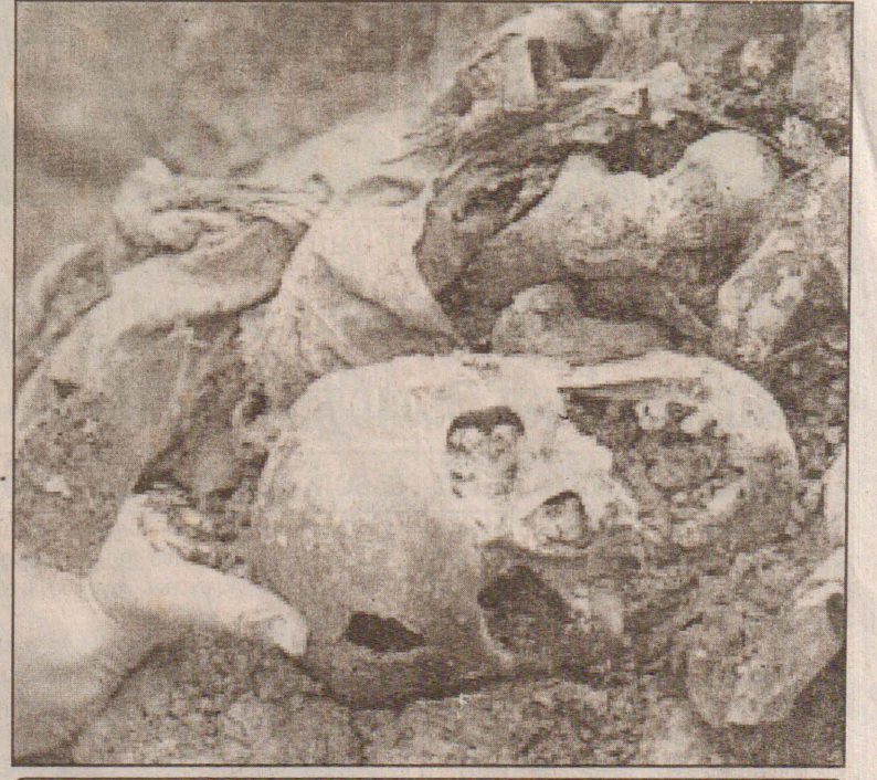
பொன்னியாவில் சேர்பியா என்ற இடத்தில் கடந்த 1992 கிருந்து 1995 வரையான காலப்பகுதியில் சேர்பியர்களுக்கும் முஸ்லிம் களுக்கும் இடையில் நடைபெற்ற மோதல்களில் கொல்லப்பட்ட முஸ்லிம்களின் மண்டையோடுகள் தடயவியல் அறிஞர்களால் பரிசோதப்பதற்காக குவித்துவைக்கப்பட்டிருக்கும் காட்சி.

(மும்பாய்) இந்தியாவின் மகாராஷ்டிரா மாநிலத்தின் வடபகுதியில் அமைந்துள்ள, இந்து ஆலயமொன்றில் நடைபெற்ற திருவிழாவில் ஏற்பட்ட சன நெரிசலில் அகப்பட்டு 39 பக்தர்கள் கொல்லப்பட்டனர். குடும்பமேளா என்றழைக்கப்படும் இந்தத் திருவிழாவில் கலந்துகொள்ளும் பக்தர்கள் கோதாவரி நதியில் நீராடுவதை புனிதமான ஒரு நிகழ்வாகக் கருதுவார்கள். ஒடுங்கிய பாதைவழியாக கட்டுப்பாடின்றி மக்கள் செல்ல முற்பட்டதாலேயே இந்த மரணம் சம்பவித்ததாகத் தெரிவிக்கப்படும் அதேவேளை - துறவி ஒருவர் பணத்தைக் கைவிட்டு எறிந்தபோது அதை எடுக்க முண்டியடித்தபோதே இவ்விபத்து நிகழ்ந்ததாகவும் தெரிவிக்கப்படுகிறது. நான்கு ஆண்டுகளுக்கு ஒருமுறை கொண்டாடப்படும் இந்தத் திருவிழாவில் ஒவ்வொரு முறையும் பல மில்லியன் மக்கள் கலந்துகொள்வது குறிப்பிடத்தக்கது.