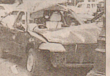
பெண் தீவிரவாதிகளை சுடுபடுத்தி வருவதாக மும்பாய் பொலீஸார் தெரிவித்துள்ளனர். இதற்கான விசாரணையில் மூன்று பொலீஸ் பிரிவுகள் தீவிர தேடுதல் வேட்டையில் இறங்கியுள்ளன.

மும்பை குண்டு வெடிப்புச் சம்பவம் தொடர்பாக, சந்தேகத்திற்கிடமான மர்மப் பெண்ணையும் வேறொருவரையும் பொலீஸார் தேடிவருகின்றனர். அவர்கள் இருவரும் பயணம் செய்த வாகனத்திலேயே குண்டு வைக்கப்பட்டிருக்கலாம் என்ற சந்தேகத்திலேயே அவர்கள் தேடப்பட்டு வருகின்றனர். அவர்கள் பயணம் செய்த வாகனச் சாரதியிடம் பொலீஸார் நடத்திய விசாரணையில் இது தெரியவந்துள்ளது. இதேவேளை - மும்பாய் புற நகர்ப்பகுதியில் சந்தேகத்திற்கிடமான மூன்றுபேரை பொலீஸார் கைதுசெய்து விசாரணை நடத்தி வருகின்றனர். குண்டுவெடிப்புச் சம்பவங்களில், 'லஷ்கர் இ தொய்பா' இயக்கத்தினர்