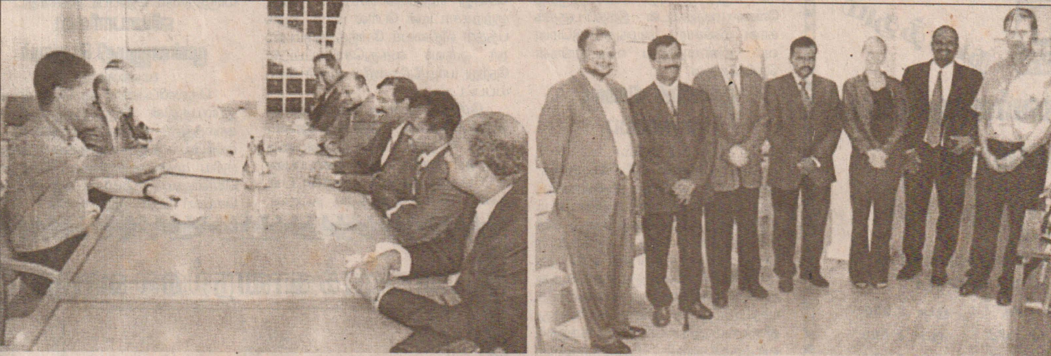
பாரிஸில் நேற்றுமுன்தினம் தமிழ்ச்செல்வன் தலைமையிலான விடுதலைப் புலிகளின் பிரமுகர்களை, நோர்வே விசேட சூதுவர் எரிக்கொல்லெயும் சந்தித்துப் பேச்சு நடத்தியபோது எடுக்கப்பட்ட படங்கள்.

மலர் : 01 திருவள்ளூர் ஆண்டு: 2034 ஆவணி 11 ஆம் நாள், ஹிஜ்ரி 1425 ஜ.ஆகிர் 29 (28.08.2003) விழாபுக்கியுமை இதழ் : 328