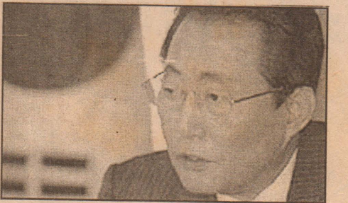
இதனிடையே தொலைக்காட்சி செய்தியில் மக்கள் அரசியல் சட்ட நீதிமன்றத்தின் முடிவு தெரிவிக்கப்படும் வரை அமைதியைப் பேணுமாறு ஜனாதிபதி ரு மூ கையுள் கேட்டுள்ளார்.

நடைபெற்றன. தற்போது மேற்கொண்டுள்ள கருத்துக் கணிப்பில் எழுபது வீதமான மக்கள் சட்ட சபையின் முடிவுக்கு ஆதரவு தெரிவிப்பதற்கு மறுப்புத் மறுத்துள்ளனர். தென்கொரிய மக்களுக்கு எதிர்க்கட்சிகள் மேற்கொண்ட முடிவு அதிர்ச்சியினைக் கொடுத்துள்ளதாக மேலும் தெரிவிக்கப்படுகிறது. ஜனாதிபதி ரோ தனது ஜந்து வருட ஆட்சிக் காலத்தில் ஒரு வருடம் மாத்திரமே கடமையாற்றியுள்ளார். மேலும் வேட்பாளர் சட்டத்தில் ஜனாதிபதியினால் மேற்கொள்ளப்பட்ட சிறிய குற்றத்திற்காக அவரை பதவியிலிருந்து நீக்க முற்பட்டுள்ளமை சதிப் புரட்சியென ஆதரவாளர்கள் தெரிவித்தனர்.