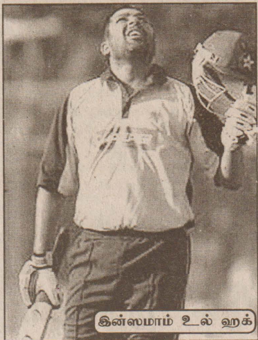
இன்ஸுமாம் உல் ஹக்

இந்திய - பாகிஸ்தான் அணிகளுக்கிடையில் கராச்சியில் நேற்று நடந்த பரபரப்பான சர்வதேச ஒருநாள் போட்டியில் இந்திய அணி 5 ஓட்டங்களால் பாகிஸ்தானைத் தோற்கடித்தது. முன்னதாக நானாய்ச்சுமர் சியல் வென்ற பாகிஸ்தான் அணித்தலைவர் இன்ஸுமாம் உல்ஹக் இந்திய அணியை முதலில் துடுப்பு பெடுத்த தாட அழைத்தார்.