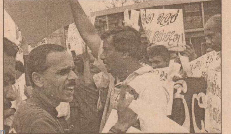
ரயில்வே திணைக்களத்தை தனியார் மயப்படுத்துவதற்கு எதிர்ப்புத் தெரிவித்து, நேற்றுமுன்தினம் மருதானையில் நடைபெற்ற ஆர்ப்பாட்டத்திலிருந்து...

வெளிப்படையாக உரையாடல் களை நடத்திச் சமாதானப் பேச்சுவார்த்தை ஆரம்பிக்கப்படுமானால், அதற்கு விரோதமாகச் செயற்படும் சக்திகளுக்குப் பதில்வழங்க ஜாதிக ஹெல் உறுமய முன்வரும் எனவும் அவர் தெரிவித்தார். (தே)