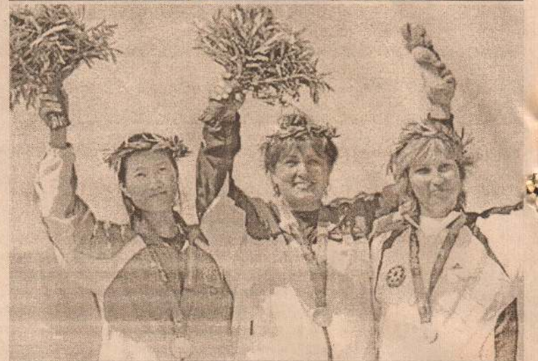
பனிச்சறுக்கல் போட்டியில் வெள்ளி வென்ற சீனா, தங்கம் வென்ற ஹங்கேரி, வெண்கலம் வென்ற அசர்பைஜான் வீராங்கனைகள்