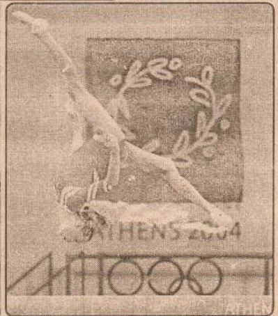
ஜீம்னாஸ்டிக் பிரிவில் தங்கம் வென்ற ரஷ்ய வீராங்கனை களில் ஒருவரான ஸ்வெர்லானா கோர்கனா