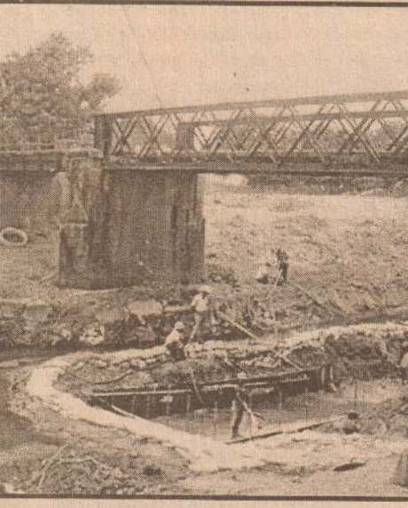
முல்லைத்தீவு - பரந்தன் வீதியில் உள்ள பாலம் கட்டும் இடம்.