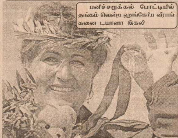
பனிச்சறுக்கல் போட்டியில் தங்கம் வென்ற ஹங்கேரிய வீராங்கனை டயானா இகல்