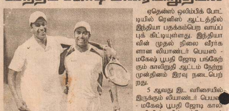
சேர்ந்த வெய்னி பிளாக் - உல்லட் ஜோடியை எதிர்கொண்டது. இதில் பெயஸ் - யூபதி ஜோடி 6-4, 6-4 என்ற நேர் செட் கணக்கில் வென்று அரையிறுதிக்குத் தகுதிபெற்றது. இந்த வெற்றியைப் பெற இந்திய ஜோடிக்கு ஒரு மணி நேரம் தேவைப்பட்டது.