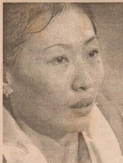
பட்மின்டன் தனிநபர் போட்டியில் தங்கம் வென்ற சீன வீராங்கனை