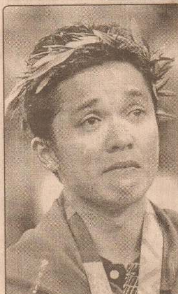
பட்மின்டன் தனிநபர் ஆண்கள் பிரிவில் தங்கம் வென்ற இந்தோனேஷிய வீரர் தெளபிக் ஹிதயத்.