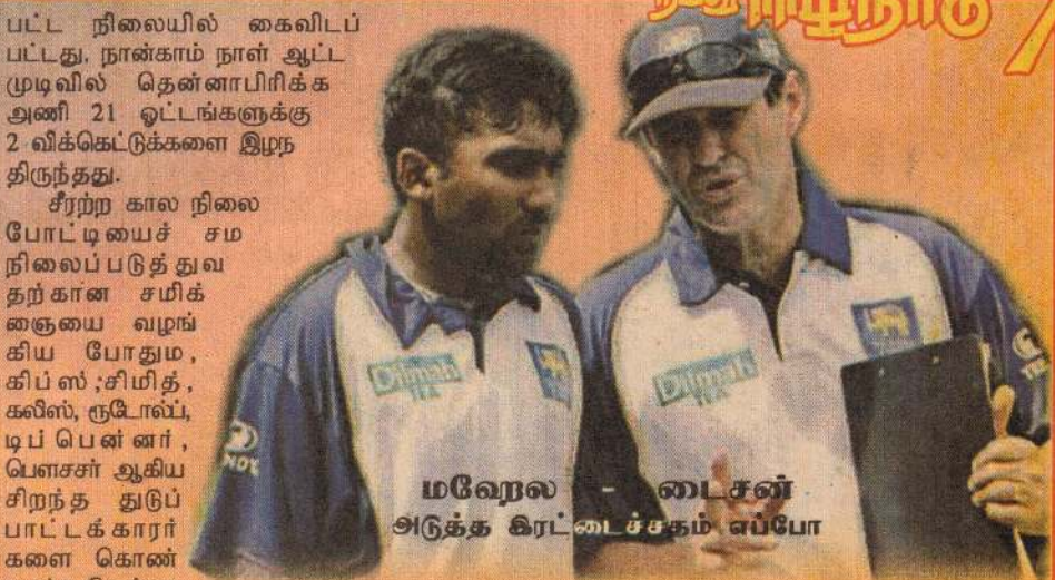
மவேரல் - டைசன் அடுத்த கிரட்டைச்சகம் எப்போ

சீரற்ற கால நிலை போட்டியைச் சம நிலைப் படுத்துவதற்கான சமீக வரையறை வழங்கிய போதும், கிப்ஸ்; சிமித், கலிஸ், ரூடோல்ப், டிப் பென்னர், பெளசன் ஆகிய சிறந்த துடுப்பாட்டக்காரர்களை கொண்டு இருந்த தென்னாபிரிக்க அணி தோல்வியைத் தழுவினமைக்கு இலங்கை அணி அனைத்துத்தரையிலும் பிரகாசித்தமையே காரணமாகும். இலங்கை அணியின் களத்தடுப்பு, பந்துவீச்சு, மற்றும் துடுப்பாட்டம் ஆகிய அனைத்தும் சிறப்பாகவே அமைந்திருந்தது. குறிப்பாக இலங்கை அணியின் பந்துவீச்சாளர்கள் மிகவும் சிறப்பாகச் செயற்பட்டனர். சமிந்தவாஸ், புதுமுகம் லசித் மாலிங்க, ஜயகுரிய ஆகியோர் மிகவும் சிறப்பாகப் பந்துவீசினர். 5 ஆம் நாள் ஆட்டத்தின் போது தென்னாபிரிக்க அணியின் துடுப்பாட்ட வீரர்களை திறைமீட்ட சமிந்தவாசும், மாலிங்கவும் எந்த ஆடுகளத்திலும் தாம் சாதிப்போம் என்பதை வெளிப்படுத்தியுள்ளனர். எஸ்.எஸ்.சி மைதானத்தைப் பொறுத்தவரையில் சுழற்சி வீச்சாளர்களுக்கே சாதகமானது. டெஸ்ட் வரலாற்றிலே அதிக வீக்கெட்டுக்களைக் கைப்பற்றி சாதனை படைத்துள்ள இலங்கை அணியின் சுழற்சி வீச்சாளர் முரளிதரன், தனது டெஸ்ட் வீக்கெட்டுக்களில் 100 இற்கு மேற்பட்டவற்றை எஸ்.எஸ்.சி மைதானத்திலேயே கைப்பற்றியுள்ளார். ஆனால், இலங்கை அணியின் வேகப்பந்து வீச்சாளர்கள் எஸ்.எஸ்.சி மைதானம் சுழற்சி வீச்சாளர்களுக்கே சாதகமானது என்ற கருத்தை மாற்றியமைத்து விட்டனர். கடந்த சில காலங்களில் பல வீழ்ச்சிகளைக் கண்ட இலங்கை அணி மீண்டும் புத்துயிர் பெற்றுள்ளமை மகிழ்ச்சியான விடயமே. தென்னாபிரிக்க அணிக்கு எதிரான டெஸ்ட் தொடரை வெற்றி கொண்டுள்ள இலங்கை அணி - தென்னாபிரிக்க அணிக்கு எதிரான ஒரு நாள் தொடரையும் கைப்பற்றிச் சாதனை படைக்கும் என்பது உறுதி.