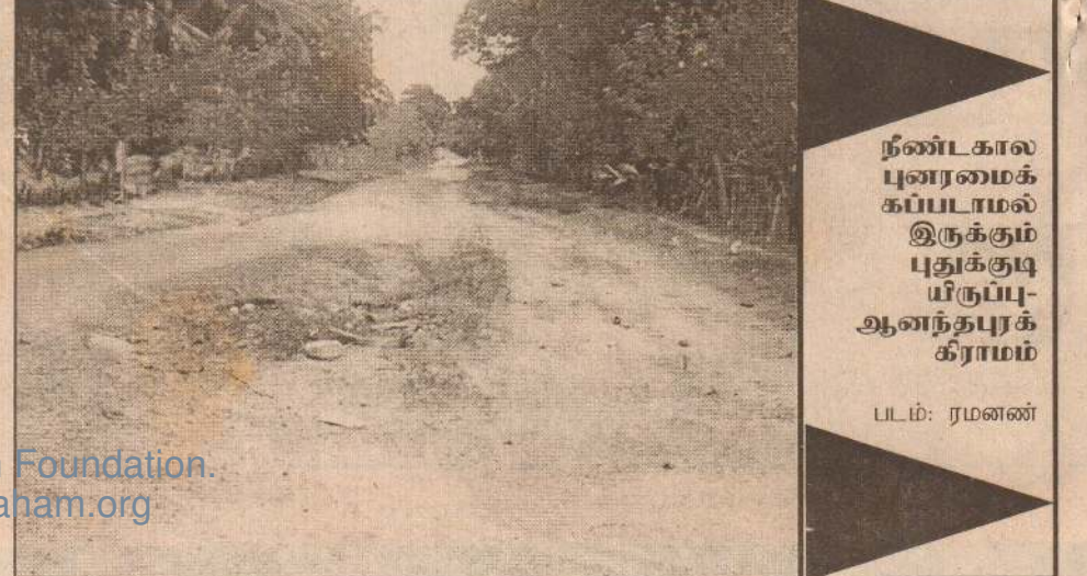
நீண்டகால புனரமைக்கப்படாமல் இருக்கும் புதுக்குடியிருப்பு-ஆனந்தபுரக் கிராமம்

இயங்கி வந்தது. இந்த பிரதேச சபை தற்போது வடக்கு - கிழக்கு அவசர புனரமைப்பு திட்ட நிதியுடன் புனரமைக்கப்பட்டு மிக விரைவில் திறந்து வைக்கப்படவுள்ளது. இதேவேளை வன்னி பகுதியில் ஏற்பட்டுள்ள கரும் வரட்சி காரணமாக புதுக்குடியிருப்பு அரசினர் வைத்தியசாலை கிணற்றில் நீர் வற்றிச் செல்கின்றமையினால் நோயாளிகள் மிகுந்த சிரமங்களை எதிர்நோக்குகின்றனர் என தெரியவருகின்றது.