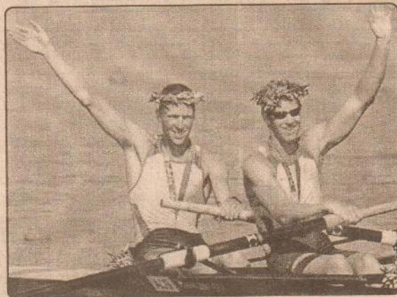
துடுப்பு வலித்தலில் தங்கம் வென்ற கிரட்டையர்