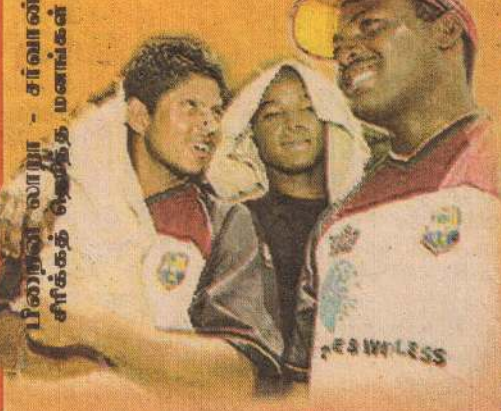
பிறைவா லாரா - சர்வான் சர்க்கத் தேவந்த மணிகள்

இங்கிலாந்தில் விளையாடிய மூன்று டெஸ்ட் போட்டிகள் தோல்வி. தொடரின் ஆட்டங்கள் தொடர்ந்து நடந்தாலும் ICC சம்பியன்ஷிப் போட்டிக்கான மேற்கிந்திய அணி பற்றிய அறிவிப்பின் அவசியம் மேற்கிந்தியத் தேர்வுக் குழுவுக்கு இந்த நிலையில் மேற்கிந்திய தீவுகள் அணியின் தலைவர் யார் என்பதைத் தீர்மானிப்பதில் ஏற்பட்ட தாமதம் பல விடயங்களை எடுத்துக்காட்டியுள்ளது. அதாவது அணித் தலைமை பிறைன் லாராவின் கையில் இருப்பதில் தேர்வுக் குழுவுக்கு அவ்வளவு திருப்தியில்லை என்பது வெளிப்படையாயிற்று. இது லாராவின் மனதிலும் ஒரு தாழ்வு ஏற்படுத்தியிருக்கும். தற்போது இன்னும் இரண்டு வாரங்கள்