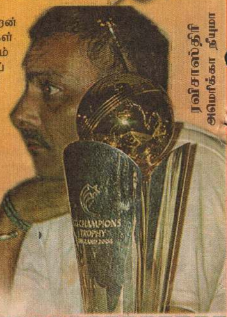
ரவிசாஸ்திர அமெரிக்கா தீபுமா

மிகுதி டெஸ்ட் போட்டி பற்றிச் சிந்திக்கவேண்டியுள்ளது என்றமட்டும் கூறியுள்ளார். தாமதமாக ICC கிண்ணத் தலைமை லாறாவுக்குக் கிடைத்தாலும், தற்போது அவரது நிலை வேண்டாம் பெண்டாட்டி நிலைதான். லாராவுக்கு இரண்டாவது முறை தலைமைத்துவம் கொடுக்கப்பட்டது அவர் மீது கொண்ட நம்பிக்கையால் தான். ஆனால் அவரால் அதனைச் சரிவர நிறைவேற்ற முடியாது போயிற்று என்பதே உண்மை. ஏனெனில் இரண்டாவது தலைமையில் விளையாடிய டெஸ்ட் போட்டிகள் 38. வென்றது 10. தோற்றது 21. அதுமட்டுமல்ல ஒரு விமர்சகர் குறிப்பிட்டது போல இறுதியில் பங்களாதேஷ் அணிக்குச் சவால் விடும் நிலையில்தான் லாராவின் நிலை இறங்கிப் போய்விட்டது. இறுதியாக நடைபெற்ற 10 டெஸ்ட் போட்டிகளில் எட்டில் தோல்வி. மறுபுறம் ஏறத்தாழ முப்பதுகளைக் கடந்த ரிட்வி ஜேக்கப்ஸ் அணியில் இருந்து நீக்கப்பட்ட அதே வயதில் நிற்கின்றார் லாரா. மேலும் மிக