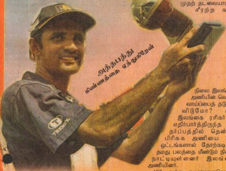
அத்தபத்து கிண்ணத்தை ஏந்தினார்

இலங்கை டெஸ்ட் வரலாற்றில் தென்னாபிரிக்க அணிக்கு எதிரான தொடரை இலங்கை அணி கைப் பற்றியமை இதுவே முதற் தடவையாகும். சீரற்ற கால