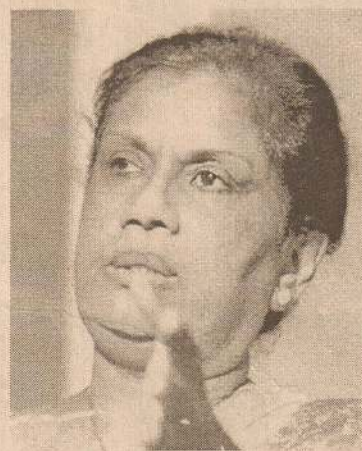
தள்ளார். சீனாவின் செல்வாக்கு மிக்க

(கொழும்பு) போபஸ் நிறுவனம் சர்வதேச ரீதியில் நடத்திய கருத்து கணிப்பின் அடிப்படையில் வெளியிடப்பட்ட - உலகின் பலம்மிக்க - முக்கியமான பெண்களின் பட்டியலில் இலங்கை ஐனாதிபதி சந்திரிகா குமாரதுங்கவுக்கு 44 ஆவது இடமே கிடைத்தது. போபஸ் சஞ்சிகை நேற்று முன்தினம் வெளியிட்ட இந்தப் பட்டியலில் - அமெரிக்காவின் அனைத்துப் பாதுகாப்பு நடவடிக்கைகளுக்கும் பொறுப்பாக மிக முக்கிய பதவியை வகித்து லூஸ் அமெரிக்க ஐனாதிபதி சந்திரிகா குமாரதுங்கவுக்கு 44 ஆவது இடமே கிடைத்தது.