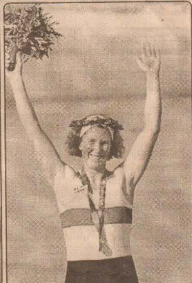
ஜூம்னாஸ் டிக்கில் தங்கம் வென்ற அமெரிக்க வீராங்கனை

தென்னாபிரிக்காவுக்கு எதிரான முதலாவது ஒருநாள் போட்டியில் இலங்கை அணி 3 விக்கெட்டுக்களால் வெற்றிபெற்றது. நேற்றுமுன்தினம் கொழும்பில் நடைபெற்ற இந்தப் போட்டியில் முதலில் துடுப்பெடுத்தாடிய தென்னாபிரிக்க அணி 50 ஓவர்கள் நிறைவில் 9 விக்கெட் இழப்புக்கு 263 ஓட்டங்களைப் பெற்றது. சிமித் 38, கிப்ஸ் 0, கலிஸ் 74, ருடோல்ப் 22, பொலக் 30, பெளசர் 58, குளுஸ்னர் 15, டுமினி 4, போயே 2, டௌசன் 3, என்ரினி 5 ஓட்டங்களைப் பெற்றனர். சமீந்த வாஸ் 4, சந்தன 2, ஜயசூர்யா, லொக்கு ஆராய்ச்சி ஆகியோர் தலா ஒரு விக்கெட்டையும் வீழ்த்தினர். இதையடுத்து துடுப்பெடுத்தாடிய