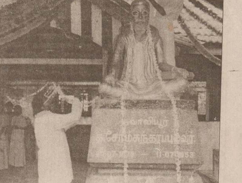
நவாபி மகாவித்தியாலயத்தில் அண்மையில் நடைபெற்ற பல்புற அறிஞர் நவாபி சோமசுந்தரப் புலவர் நினைவுத்தினத்தினால்தான் - அரவகு சீலையை செஞ்சிசாந்திரசெல்வர் ஆறு திருமுருகன் சிந்துவைப்பதைப் படத்தில் காணலாம். (111)