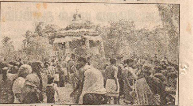
அண்மையில் வவுனியா பூந்தோட்டம் நரசிங்கர் ஆலயத் தேர்த் திருவிழாவில் கலந்துகொண்ட பக்தர்களைப் படத்தில் காணலாம்.

கள் தமது வைத்திய தேவைகளைப் பெறுவதற்கு இங்குள்ள திலீபன் மருத்துவமனைக்கு செல்ல வேண்டியுள்ளது. இதனால் சேவை நலன் கொண்ட மருத்துவர்கள் திலீபன் மருத்துவமனைக்கு வந்து சேவையாற்ற வேண்டும் எனக் கேட்டுக் கொள்ளப்படுகின்றனர்.