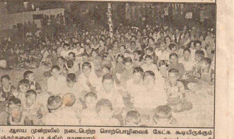
ஆலய முன்றலில் நடைபெற்ற சொற்பொழிவைக் கேட்க கூடியிருக்கும் பக்தர்களைப் படத்தில் காணலாம்.