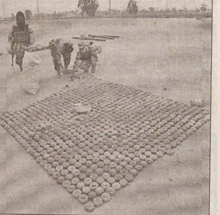
49ஆக்கில் சதாம் ஒதுவுக் கிளர்ச்சியாளர்களால் ஒப்படைக்கப்பட்ட உண்ணவிலகல் மற்றும் மீதவிலகலான 49ஆக்கிய ரிஷிய காவல் படைவீரர் பாலவயடுவதைக் காணலாம். ஒடுந்த வடுடம் ஜனவரி மாதம் நடைபெறவுள்ள ரிஷியவுக்கு முன்னர் சகல பட்டவீரோ த ஒதுவுக் கணையும் கணையப் போவதாக 49ஆக் ஐராங்கும் குழுநூற்றுக்கணக்கான மையம் குற்றப்படுத்தக்கூடும்.