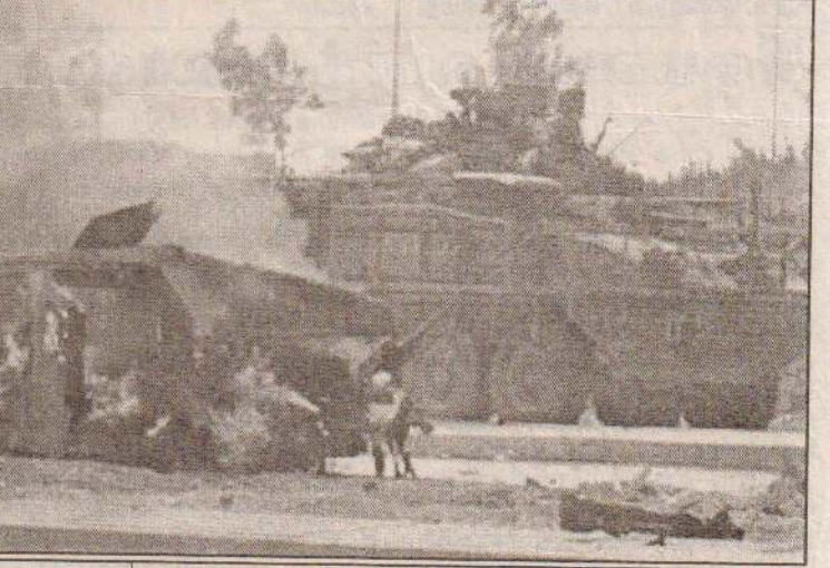
49ஆக்கில் மொகூல் ருகீல் ஓடுமெக்க இராணுவத் தொடரணர் ஒன்றின் மீது நேற்று நடைபெற்ற தற்கொலைக் குண்டுத் தாக்குதலில் தற்கொலையாளியின் வாகனம் தீப்பிடித்து எரிவதைக் காணலாம். இரத்தச் சம்பவத்தில் முன்னர் ஓடுமெக்கப் படைவீரர் காயமடைந்தனர்.

இடம்பெயர்ந்த மக்களுக்கு உதவிப்பணிகளை வழங்க முன்னர் வேறு சில தடைகள் இருந்தன. ஆனால் தற்போது பாதுகாப்பு பிரச்சினையே முக்கிய தடையாக உள்ளதாக சிலவா தெரிவித்தார். இந்த மக்களுக்கான உதவிப்பணிகளை எடுத்துச் செல்லும் வேளை கொள்ளையர்கள் அவற்றைக் கொள்ளையடித்துச் செல்வதாகவும் இதனால், தாம் மிகுந்த கவலையடைவதாகவும் அரசாங்கத்திற்கும் கிளர்ச்சிவாதிகளுக்கு மிடையில் யுத்தநிறுத்த ஒப்பந்தம் கடந்த ஏப்ரல் மாதத்திலிருந்து நடைமுறையில் உள்ள போதும் இடம்பெயர்ந்த மக்கள் வசதிக்காக கரித்து வருவதாகவும் அவர் தெரிவித்தார்.