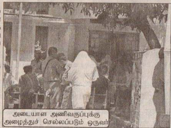
அடையாள அணிவகுப்புக்கு அழைத்துச் செல்லப்படும் ஒருவர்