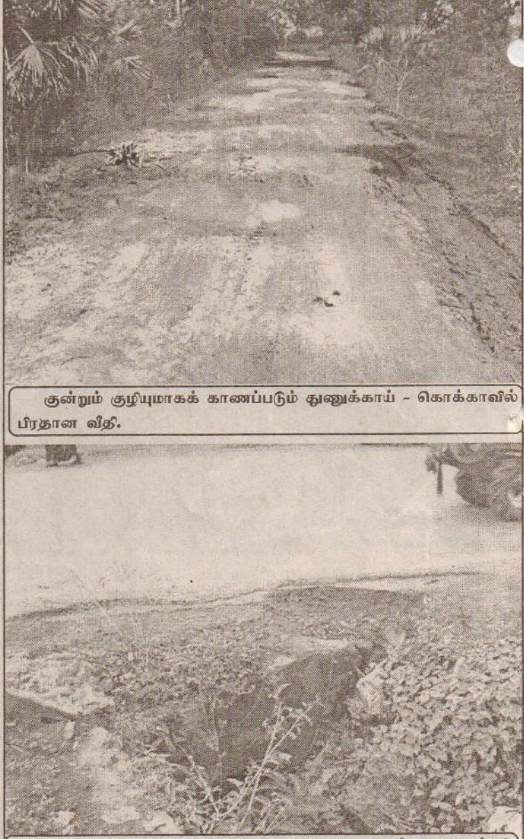
குன்றும் குழிபுமாகக் காணப்படும் தூணுக்காய் - கொக்காவில் பிரதான வீதி. கிளிநொச்சி கந்தசாமி கோயிலடி மதகு உடைந்து காணப்படுகிறது. இந்த வீதியால் பயணிக்கும் வாகனங்கள் அடிக்கடி விபத்துககுள்ளாவது குறிப்பிடத்தக்கது.

புதுக்குடியிருப்பு பிரதேசத்தில் சிமெந்தின் விலை அதிகரித்துள்ளதால் பாவனையாளர்கள் விசனம் அடைந்துள்ளனர். தற்போது இந்தப் பிரதேசத்தில் ஒரு பைக்கர் சிமெந்தின் விலை ரூபா 620 முதல் ரூபா 650 வரை விற்கப்படுவதால் பாவனையாளர்கள் விசனம் அடைந்துள்ளனர். இதேவேளை, கிளிநொச்சிப் பகுதியிலும் ஒரு பைக்கர் சிமெந்து ரூபா 620 மேல் விற்பனை செய்யப்பட்டு வருவதாக இந்தப் பகுதி மக்கள் தெரிவித்தனர்.