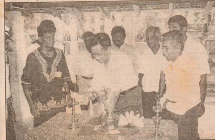
யாழ். மாவட்ட மக்கள் நலன்புரிச் சங்கமும், பயனாளிகளும் நடத்திய பயிற்சிப் பட்டறையை யு.என்.எச்.சி.ஆர் யாழ் வதவிடப் பிரதிநிதி, மருத்துவ விளக்கேற்ற ஆரம்பித்து வைப்பதைப் படத்தில் காணலாம்.