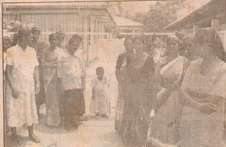
வெண்புறா கிராம அலுவலர் இடமாற்றத்தை எதிர்க்கும், சங்கானை பிரதேச செயலகத்திற்கு முன் - நேற்று மறியற் போராட்டத்தில் ஈடுபட்டிருந்த மக்களில் ஒரு பகுதியினரைப் படத்தில் காணலாம்.

இந்த திட்டத்தை முன்னெடுத்துச் செல்ல வசதியாக சாவகச்சேரி, உடுவில் ஆகிய இடங்களில் கண்ணி வெடி விழிப்புணர்வுக் கிளைச் செயலகங்கள் மூலம் செயற்திட்டங்கள் முன்னெடுத்துச் செயற்படவுள்ளது.