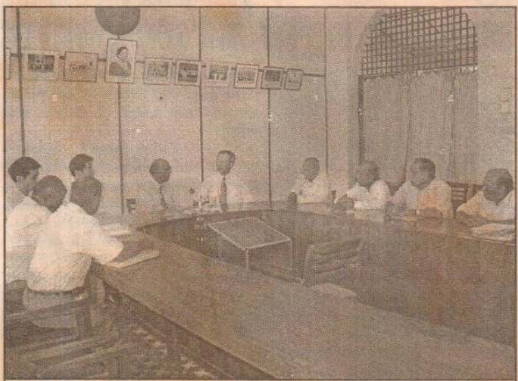
இலங்கைக்கான ஜப்பானியத் தூதரவரும் செயலாளரும் நேற்று முன்தினம் யாழ். பல்கலைக்கழகத்திற்கு வந்து செய்தவேளை எடுக்கப்பட்ட படம்.

ஐக்கிய மக்கள் சுதந்திர முன்னணியின் தேசியப் பட்டியல் உறுப்பினர்களாக நாடாளுமன்றத்துக்குத் தெரிவாகியுள்ள இவ்விருவரது பெயர்களும் தேர்தலுக்கு முன்பாக முன்னணியின் தேசியப் பட்டியல் உறுப்பினர் பெயர்களுள் உள்ளடக்கப்பட்டிருக்கவில்லை. தேர்தல் முடிவடைந்த பின்பே இவர்கள் தேசியப் பட்டியல் நாடாளுமன்ற உறுப்பினர்களாகத் தெரிவாகியுள்ளமை குறிப்பிடத்தக்கது.