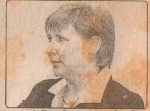
களுக்கும் இடையிலான உறவுகள் குறித்து ஆராய்வார் எனத் தெரியவருகிறது. (12 ஆம் பக்கம் பார்க்க)

இலங்கை வரும் ரொக்கா, பல்வேறு அரசியல் தலைவர்களையும் சந்தித்து இரு நாடு