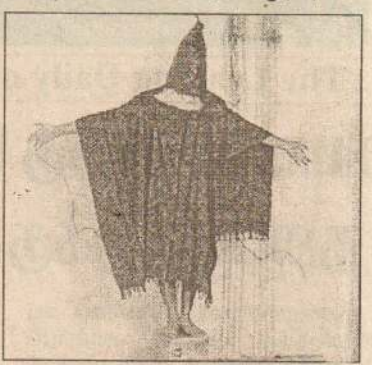
வித்திருந்தது. ஆனால், ஈராக்கில் கைதிகள் மீது இந்தவகையான துஷ்பிரயோகங்கள் மேற்கொள்ளப்பட்டுவருவது

ஈராக்கில் கைதியொருவர் மீது விசாரணை மேற்கொள்ளும்போது இதுவரை பாவிக்கப்பட்டுவந்த சில வழிமுறைகளை நிறுத்திவிடுமாறு அமெரிக்கப் படைகளிடம் தெரிவித்துள்ளதாக வொஷிங்டன் அதிகாரிகள் தெரிவித்துள்ளனர். நித்திரைகொள்ள விடாது தடுத்தல், புலன் உறுப்புக்களை நன்கு செயற்படவிடாது தடுத்தல், இயல்பிற்கு மாறான நிலையில் நிற்க அல்லது இருக்கவைத்தல் ஆகியன தடுக்கப்பட்டுள்ளன. அத்துடன் 72 மணித்தியாலங்களுக்கு மேல் கைதி ஒருவரை நித்திரைகொள்ளவிடாது தடுத்தல் முற்றாகத் தடைசெய்யப்பட்டுள்ளது. தலைப்பகுதியை மூடி மறைப்பதும் தடைசெய்யப்பட்டுள்ளது. கடந்த செப்டெம்பர் மாதம் இந்த வகையான தண்டனைகளைப் பென்றாக அனுமதித்திருந்தது. ஆனால், இந்த வகையான தண்டனைகளை ஈராக்கிலுள்ள உயர் இராணுவ அதிகாரிகளின் உத்தரவின் பின்னரே செயற்படுத்தவேண்டும் எனவும் தெரி