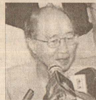
அரசாங்கப் பேச்சாளர் ஒருவர்

இரு பகுதியினருக்கும் இடையிலான அதிகாரபூர்வமற்ற பேச்சுக்களை ஆரம்பிப்பது தொடர்பான நேரம், இடம், திகதி என்பனவற்றை அனுசரணையாளரான நோர்வே விரைவில் அறிவிக்கவுள்ளதாக அரசாங்கத்தின் பேச்சாளர் ஒருவர் தெரிவித்தார்.