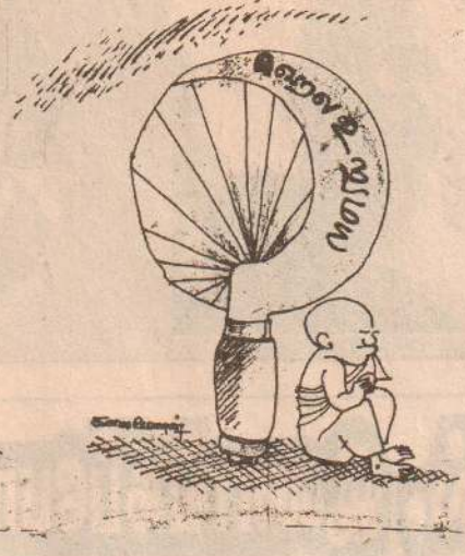
செய்தி:- கிடைக்காத முறைகளைத் தூண்டிவிடுவதன் மூலம் சமாதான முயற்சிகளைக் குழப்ப ஹைலுமயவீனர் முயற்சி செய்வதாக ஜே.வி.பியினர் குற்றச்சாட்டு