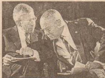
வெளியுறவு அமைச்சர் ஜக்ஸ்ரோ ஆகியோரும் ஈராக்கிலிருந்து தமது படைகளை புதிய அரசு விரும்பினால் வெளியேறும் எனத் தெரிவித்துள்ளனர்

ளின் உறுப்பினர்கள் முதன் முறையாக தமது கருத்தினை வெளியிட்டுள்ளனர். ஆனாலும், ஈராக்கிலிருந்து படைகள் வெளியேற்றும் சாத்தியமாக இருக்குமென தான் நினைக்கவில்லையென அமெரிக்க வெளியுறவுச் செயலர் கொலின் பவல் தெரிவித்தார். ஆனாலும், ஈராக்கின் புதிய அரசு விரும்பும் பட்சத்தில் அமெரிக்கா தனது படைகளை ஈராக்கிலிருந்து வெளியேற்றும் எனவும் தெரிவித்தார். இத்தாலி நாட்டு வெளிநாட்டமைச்சர் பிராங்கோ பிராட்டன்