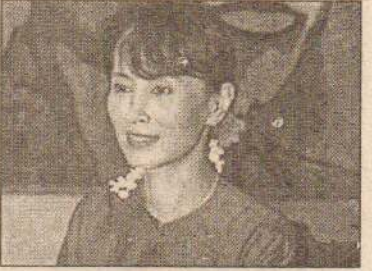
கள் புதிதாக திறப்பதற்கும் இராணுவ ஆட்சியாளர்கள் அனுமதி மறுத்து வருகின்றனர். இக் காரணங்களினாலும் கருத்தரங்கில் பங்கு பற்றவில்லையென ஆங்சாங் குகி தெரிவித்தார்.

கருத்தரங்கில் எதிர்க்கட்சி பங்குகொள்ளாத நிலையில் அவர்கள் நம்பகத்தன்மையை இழக்க நேரிடலாம் என செய்தியாளர்கள் தெரிவித்துள்ளனர். இக் கருத்தரங்கு நாளை ஆரம்பிக்கப்படவுள்ளது. மேலும் இக் கருத்தரங்கில் பங்குகொள்வதன் மூலம் எதுவித பலனையும் பெறப்போவதில்லையென ஜனநாயகக் கட்சியின் தலைவர் ஆங்சாங் குகி பத்திரிகையாளர்களுக்கு தெரிவித்திருந்தார். எதிர்க்கட்சித் தலைவி ஆங்சாங் குகி மற்றும் கட்சியின் உப தலைவர் ஆகியோர் தொடர்ந்தும் வீட்டுக்காவலில் வைக்கப்பட்டுள்ளனர். மேலும் எதிர்க்கட்சி அலுவலகம்