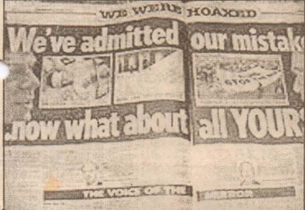
பிரித்தானியாவின் டெய்லிமிரர் பத்திரிகை - ஈராக் கைதிகள் துன்புறுத்தல் தொடர்பான படங்களை அண்மையில் வெளியிட்டிருந்தது. இந்தக் குற்றங்களை பிரித்தானியாவின் லங்கர் செயர் படைப்பிரிவே மேற்கொண்டதாகவும் குறிப்பிட்டிருந்தது.

ஆனால், இந்தப் படங்கள் உண்மைக்குப் புறம்பானவை என்று தெரிவித்து அந்தப் படைப் பிரிவிடம் டெய்லி மிரர் பத்திரிகை மன்னிப்புக் கோரியுள்ளது. இந்தச் சம்பவத்தின் பின் பத்திரிகை ஆசிரியர் பியொர்ஷ் மோர்கன் பதவியிலிருந்து நீக்கப்பட்டிருந்தார். அத்துடன் இந்தப் பத்திரிகை - வாசகர்களிடமும், ஈராக்கில் பணிபுரியும் பிரித்தானிய படையினரிடமும் மன்னிப்புக் கேட்டிருந்தது. தம்மிடம் தெரிவிக்கப்பட்ட கருத்துக்களை ஆதாரமாகக் கொண்டே அந்தப் படங்கள் தயாரிக்கப்பட்டதாகவும் டெய்லிமிரர் தெரிவித்திருந்தது. இதேவேளை, இந்தப் பத்திரிகை ஆசிரியர் மோர்கன் மன்னிப்புக் கேட்டுக் கொள்வதற்கு மறுத்திருந்ததாகவும், இதனால், பதவியிலிருந்து நீக்கப்பட்டதாகவும் தெரிவிக்கப்படுகிறது.