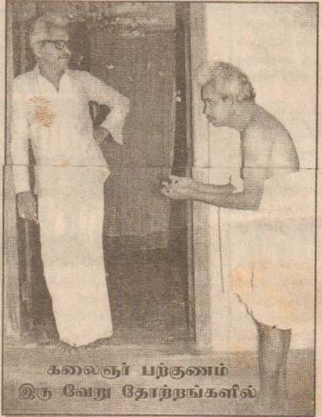
கலைஞர் பற்குணம் இரு வேறு தோற்றங்களில்

ஆகியோரைக் குறிப்பிடலாம். இவர்களில் சிலர் வசதிகளோடும் வாழ்கிறார்கள். பெரும்