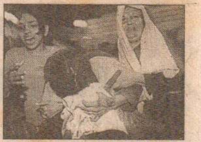
செயற்பாடுகளை உடன் நிறுத்துமாறு இஸ்ரேலைக் கேட்டுள்ளன. இதனிடையே இஸ்ரேலின் இரு இடதுசாரி நாடாளுமன்ற அங்கத்தவர்கள் இஸ்ரேலின் போர்நடவடிக்கைகளை கண்டித்துள்ளனர்.

வந்த பலஸ்தீன தீவிரவாதிகளே இஸ்ரேல் தெரிவித்துள்ளது. மேற்குக் கரைப்பிரதேசத்தில் நடத்தப்பட்ட இராணுவ நடவடிக்கையில் அல் அக்சா மாட்டியர் அமைப்பின் உள்ளூர் தலைவர் கொல்லப்பட்டுள்ளதாக பலஸ்தீனத் தகவல்கள் தெரிவித்தது. இஸ்ரேல் படையினரால் பலஸ்தீனர்கள் அழிக்கப்படுவதாக பலஸ்தீனத்தலைவர் அரபுத் தெரிவித்துள்ளார். கொல்லப்பட்டவர்களில் இரு பலஸ்தீனச் சிறுவர்களும் அடங்கியுள்ளதாக தெரிவிக்கப்பட்டுள்ளது.