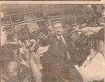
தெனத் தெரிவித்துள்ளது. இதனால் நீதிமன்றம் மனுவலுக்கு தண்டனை வழங்குவதற்கான அதிகாரங்களை பெற்றுள்ளது.

மேலும் கடந்த திங்கட்கிழமை மெக்சிக்கோவில் சட்டமா அதிபர் அலுவலகம் தெரிவிக்கும்போது நகரசபைத் தலைவரின் தண்டனைக் கெதரான உரிமைகளை நீக்கியுள்ள