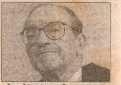
அமெரிக்க சென்சபையும் அலன் தேர்வுக்கு அங்கீகாரம் வழங்கியுள்ளது. அமெரிக்காவில் வேலையாட்களுக்கும், புதிய தொழில் முயற்சியில் ஈடுபடுபவர்களுக்கும் அதிக நன்மைகளைப் பெறுவதற்கு அலனின் திட்டங்கள் உதவியுள்ளதென தெரிவிக்கப்பட்டது. அத்துடன் அமெரிக்காவின் பொருளாதாரம் கடந்த 20 ஆண்டுகளில் அதிக வளர்ச்சி கண்டுள்ளதாகவும் பேச்சாளர் தெரிவித்துள்ளார்.

அமெரிக்காவின் பொருளாதாரத்தை கண்காணிப்பதில் அலனுக்குள்ள ஆற்றலில் அதிக நம்பிக்கை கொண்டுள்ளதாக அமெரிக்க அதிபர் புஷ் தெரிவித்துள்ளார். 78 வயதுடைய கிரின் ஸ்பான், ஏற்கனவே நான்கு தடவைகள் பதவி வகித்துள்ளார். வேறு ஒருவரை இப் பதவிக்கு அமெரிக்க அதிபர் புஷ் கேட்டபோது அலன் முடிந்தவரைக்கும் அப் பதவியை வகிக்கவேண்டுமென அதிபர் விரும்புவதாக தெரிவிக்கப்பட்டுள்ளது.