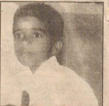
எனினும், பின்னர் சிகிச்சையளிக்கப்பட்ட போதும் சிறுவன் பரிதாபகரமாக உயிரிழந்தான். சிறுவனின் சடலம் வைத்திய பரிசோதனையின் பின்னர் அவனது பெற்றோரிடம் ஒப்படைக்கப்பட்டது. (12)

தையை அடுத்து தாயார் சிறுவனைக் கண்டித்தார். இதையடுத்து வீட்டின் பின்புறமாகச் சென்று தந்தையாரால் தோட்டத்திற்கு அடிக்கவென மறைத்து வைத்திருந்த பூச்சி மருந்தை எடுத்து அருந்தினான். சிறிது நேரத்தின் பின்னர் சிறுவனைச் சாப்பிட வருமாறு அழைத்த தாயார் சிறுவனின் வாயிலிருந்து வித்தியாசமான மணம் வருவதை அவதானித்தார். இதையடுத்து சிறுவனின் தந்தைக்கு விடயம் விளங்கியதும் சிறுவனை மந்திகை வைத்தியசாலைக்கு எடுத்துச் சென்றனர். எனினும், காலை 7.30 மணியளவில் சிறுவன் வைத்தியசாலைக்குக் கொண்டு செல்லப்பட்ட போதும், அங்கு அவசரசிகிச்சைப் பிரிவில் வைத்தியர்கள் எவரும் கடமையில் இருக்கவில்லை.