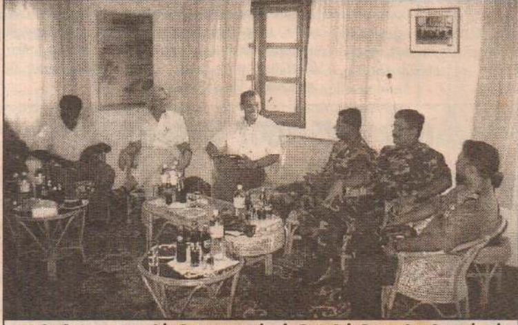
திருகோணமலையில் கிராமமன்றம் மற்றும் பொலீஸ் உயரதிகாரிகளுக்கும், விடுதலைப்புலிகளின் திருமலை மாவட்ட அரசியற்கூடையை பொறுப்பாளருக்குமான முதலாவது சந்திப்பு திருகோணமலை மாவட்டமேயுட்படுத்த நிறுத்தக் கண்காணிப்புக்குழுவினர் அலுவலகத்தில் நடைபெற்றபோது எடுக்கப்பட்ட படம்.