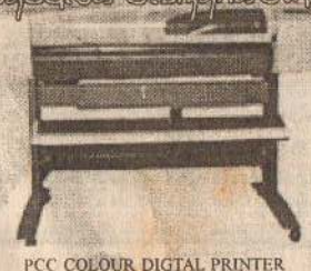
PCC COLOUR DIGITAL PRINTER