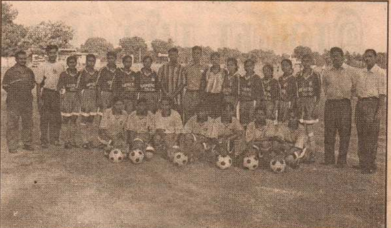
யாழ்.மாவட்ட பெண்கள் உதைபந்தாட்ட அணி வீரர்களை களையும், பயிற்றுவிப்பாளர்களையும், தமிழ் விளையாட்டுக் குறையைச் சேர்ந்தவர்களையும் படத்தில் காணலாம்.

பிரைன் லாரா (கப்டன்), ராம் நரேஷ் சர்வான், கிறிஸ் கெய்ல், டேவன் ஸ்மித், ஷிவ்நாராயண் சந்திர்போல், டேவன் ஸ்மித், ரிட்லி ஜேக்கப்ஸ் (விக்கெட் காப்பாளர்), ரவி ராம்போல், டிரோ பெஸ்ட், பில் எட்வர்ட்ஸ், ஜேம்ஸ் லோசன், டெட்ரோ கொலின்ஸ், ஓமரி பாங்ஸ், கார்ல்டன் பாஹ், டேவன் பிராவோ மற்றும் சில்வஸ்டர் ஜோசப்.