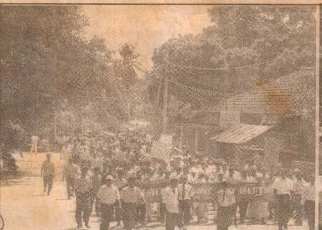
கண்டி வீதியூடாக வரும் மக்கள் கூட்டம்