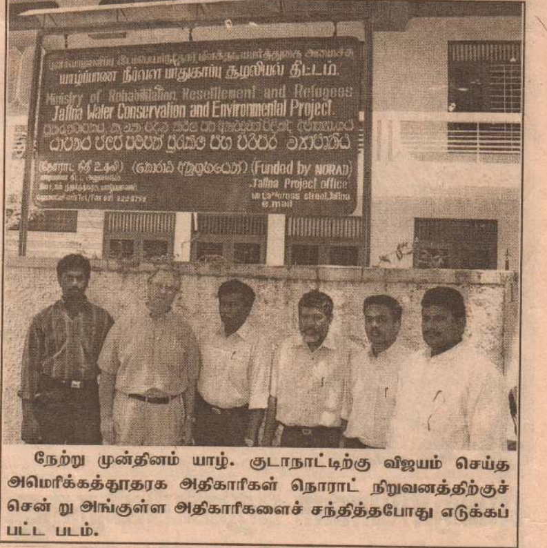
நேற்று முன்தினம் யாழ்ப்பாணம் குடாநாட்டிற்கு விஜயம் செய்த அமெரிக்கத்தூதரக அதிகாரிகள் நொராட் நிறுவனத்திற்குச் சென்று அங்குள்ள அதிகாரிகளைச் சந்தித்தபோது எடுக்கப்பட்ட படம்.

இதன்பின்னர், அவர் கண்டி தலதாமாளிகைக்குச்சென்று வழிபாடு நடத்தவுள்ளார்.