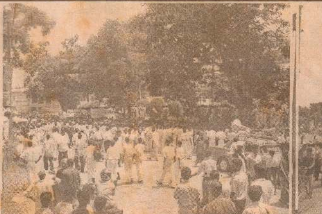
அிந்திரன்டிருந்த மாணவர் கூட்டம்.