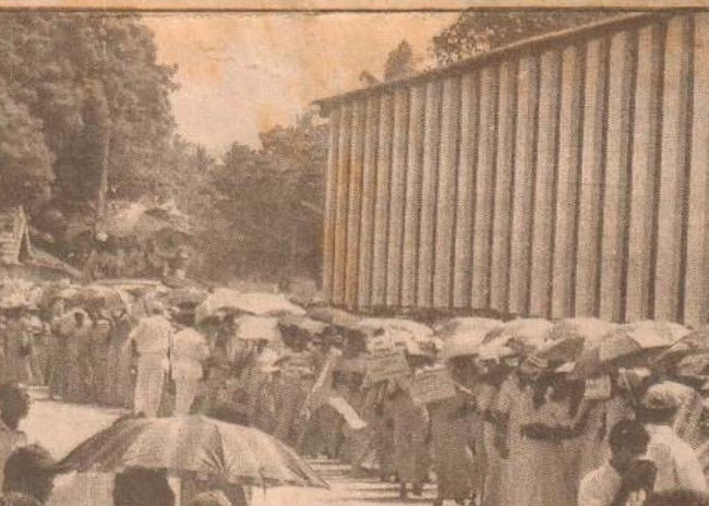
பேரணியில் கலந்துகொண்ட ஆசிரியர் கூட்டம்