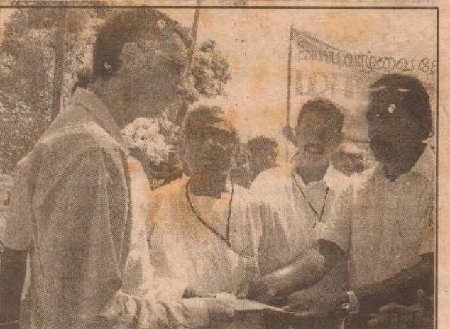
யு.என்.எச்.சி.ஆர் பிரதிநிதியிடம் மகஜர் கையளிக்கப் படுகிறது.