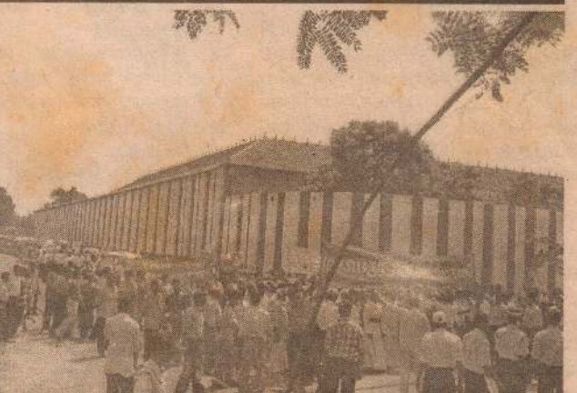
பேரணியில் கலந்துகொண்ட கின்னோர் பகுதியினர்