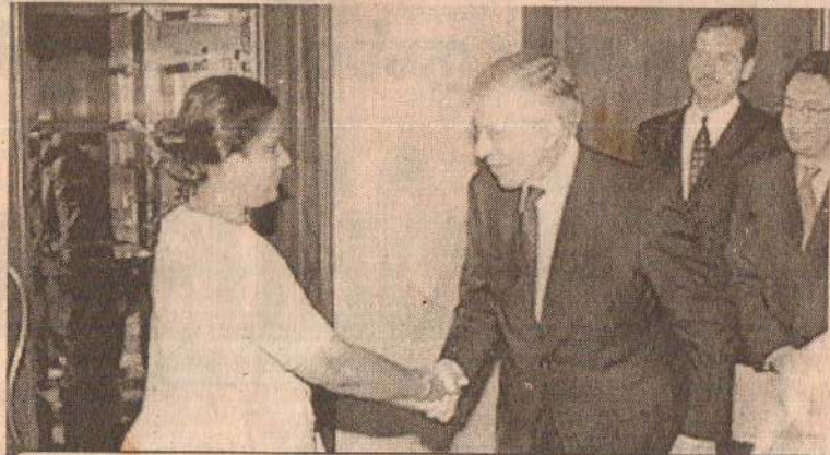
கடந்த வாரம் லண்டனுக்கு சென்றிருந்த ஜனாதிபதி சந்திரிகா, பிரிட்டிஷ் வெளிவழவத்துறை அமைச்சர் ஜக் ஸ்ரோவைச் சந்தித்து உரையாடுகின்றார்.

கிராண்ட்பாஸ் பகுதியில் இருந்து கண்டுபிடிக்கப்பட்ட குண்டு பொருத்திய அங்கி தொடர்பாக விசாரணை (12 ஆம் பக்கம் பார்க்க)