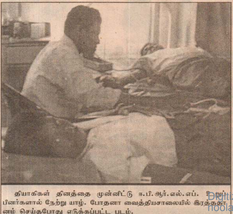
கியாக்கள் தினத்தை முன்னிட்டு ச.பி.ஆர்.எல்.எம். உறுப்பினர்களால் நேற்று யாழ். போதனா வைத்தியசாலையில் கிரத்தினாணம் செய்தபோது எடுக்கப்பட்ட படம்.