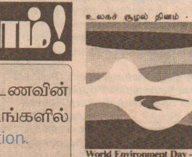
உலகச் சூழல் தினம் - யூன் 05