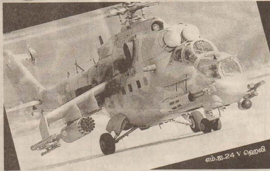
எம்.ஐ.24 V ஹெலிகாப்டர்

இந்த எம்.ஐ.24, எம்.ஐ.35 ஹெலிகாப்டர் இரந்தபோதும், ஏவுகணைகளின் தாக்குதலில் இருந்து