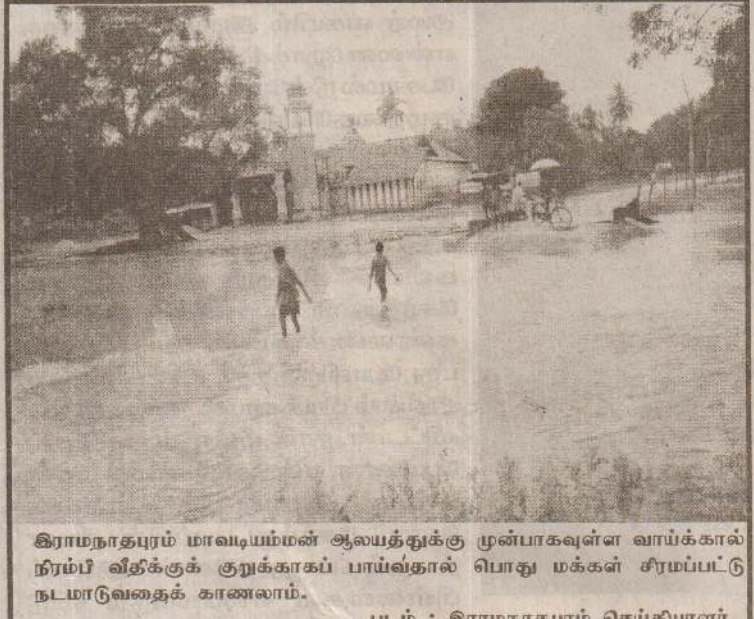
கிராமநாதபுரம் மாவட்டம் ஆலயத்துக்கு முன்பாகவுள்ள வாங்க்கால் நெய் வீதிக்குக் குறுக்காகப் பாய்வதால் பொது மக்கள் சிரமப்பட்டு நடமாடுவதைக் காணலாம்.