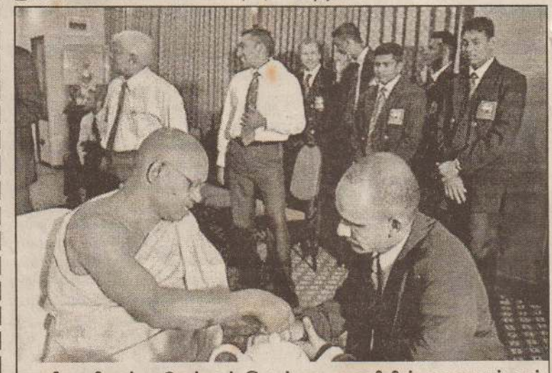
நியூஸிலாந்து செல்லும் இலங்கை அணியின் தலைவர் அத்தப்பத்து பௌத்த பிக்குவிடம் ஆசி பெறுவதைக் காணலாம்.