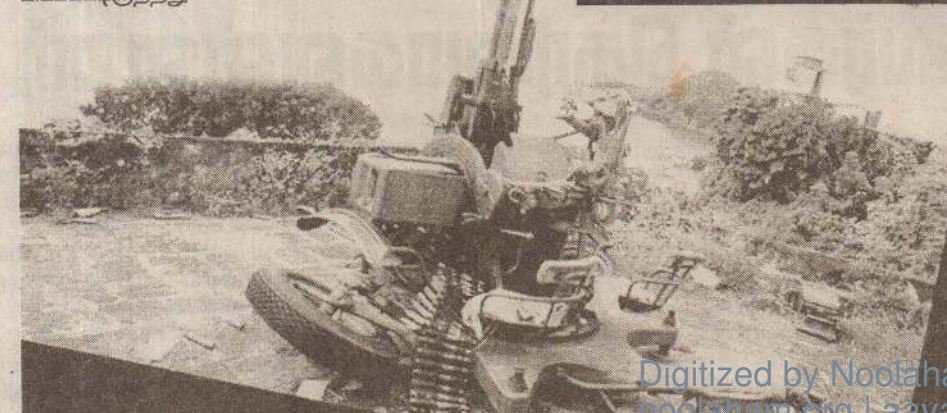
எம்.ஐ.ஹெலிகாப்டர்களுக்கு சவாலான விமான எதிர்ப்பு பிரங்கி.

எம்.ஐ.35 ஹெலிகாப்டர் விமானப் படை கொள்வனவு செய்துள்ளது என்றவுடன் வாயைப் பிளந்தவர்கள் அநேகம் பேர்.