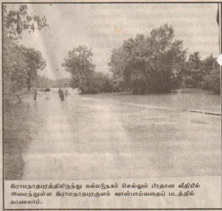
கிராமநாதபுரத்திலிருந்து கல்முனை செல்லும் பிரதான வீதியில் அமைந்துள்ள கிராமநாதபுரமும் வான்பாய்வதைப் படத்தில் காணலாம்.

தாங்கி வாகனம் மூலமாக - குடிநீர் விநியோகமும் மேற்கொள்ளமுடியாத நிலையுள்ளது. இதனால் இந்தப் பகுதி மக்கள் குடிநீரைப் பெற்றுக்கொள்வதில் பெரும் சிரமங்களை எதிர்நோக்கி வருகின்றனர்.