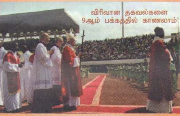
விரிவான தகவல்களை 9ஆம் பக்கத்தில் காணலாம்!