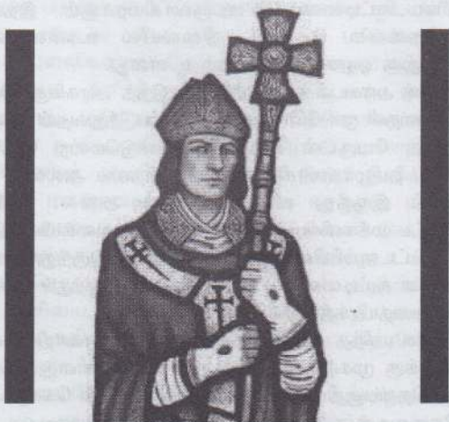
மாதமொரு புனிதரை அறிந்துகொள்வோம்