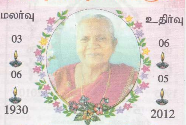
மலர்வு உதிர்வு 03 06 06 05 1930 2012