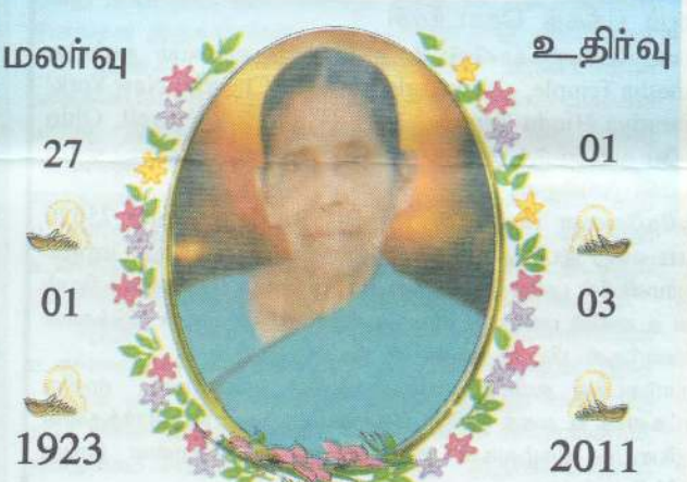
மலர்வு உதிர்வு 27 01 01 03 1923 2011