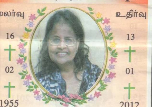
மலர்வு உதிர்வு 16 13 02 01 1955 2012