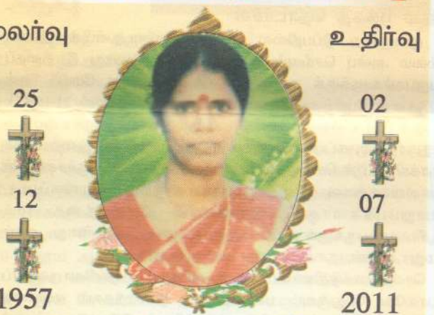
மலர்வு உதிர்வு 25 02 12 07 1957 2011