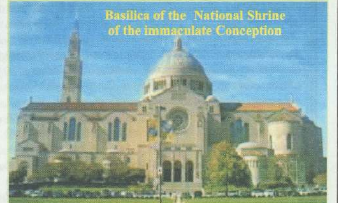
Basilica of the National Shrine of the Immaculate Conception

தூய மக்களின் மதச் சுதந்திரத்தை வலியுறுத்தி அமெரிக்க கத்தோலிக்க உயர் தேவாலயத்தில் தமிழர்களின் நீதிக்கான வேண்டுகோள்