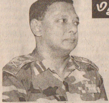
(மட்டக்களப்பு) மட்டக்களப்பின் - புல்லுமலைப் பகுதியில் விடுதலைப் புலிகளின்

இந்தச் சம்பவம் நடைபெற்ற இடத்திற்கருகில் வெடிபொருள் அகற்றும் பணியில் ஈடுபட்டுவரும் குழுவினர் தங்கியிருக்கும் இடத்திற்குச் சென்ற சிலர் தாம் காவி வந்த உடல்களை இராணுவ (12 ஆம் பக்கம் பார்க்க)