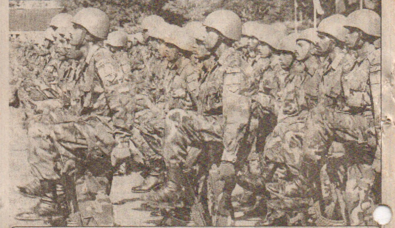
ஹெயிட்டிக்கு செல்லவுள்ள இலங்கைப் படையினரின் அணிவகுப்பு.

(கொழும்பு) இனிவரும் காலங்களில் இராணுவத்தைச் சேர்ந்த பலர் வெளிநாடுகளுக்கு அனுப்பப்பட்டு சேவைகளில் ஈடுபடுத்தப்படுவர் என இராணுவத்தளபதி ஸெனாரெட் சாந்த கொட்டை தெரிவித்தார். பனாகொட்டை படைத்தளத்தில் ஹெயிட்டிக்குச் செல்லவுள்ள இராணுவத்தினரைக் கௌரவிக்கும் முகமாக நடத்தப்பட்ட நிகழ்வில் உரையாற்றியபோது அவர் இவ்வாறு தெரிவித்தார். அங்கு அவர் மேலும் பேசும் போது - இலங்கை இராணுவத்தைச் சேர்ந்த 750 பேர் ஹெயிட்டிக்கு அமைதிக்காக்கும் பணியில் ஈடுபடுவதற்காக அனுப்பப்படவுள்ளனர். இலங்கை வரலாற்றில் முதற்தடவையாக - இலங்கை இராணுவத்தினர் வேற்றுநாட்டுப்பகுதியில் அமைதிக்காக்கும் பணியில் ஈடுபடச் செல்கின்றனர். இது இலங்கைக்கும் பெருமையைத் தேடித்தரும் ஒரு தாக்குதல்... முகாமிற்கருகில் கொண்டுசெல்ல உதவமாறு தெரிவித்து அங்கிருந்த உட்களையத் தாக்கியுள்ளார்கள். இவ்வாறான தகவல்கள் எமக்குக் கிடைத்திருக்கின்ற போதிலும் இந்தத் தாக்குதல் நடத்தியோர் குறித்து உடனடியாக எதுவும் கூற முடியாது. இது குறித்து நேற்று முழுவதும் விசாரணைகளை நடத்தினோம். அப்பகுதியில் பலருடும் பேச்சுக்களை நடத்தினோம். இராணுவத்தினர் இச்சம்பவத்திற்கும் தமக்கும் எதுவித தொடர்பும் இல்லை எனக் கூறிகின்றனர். தமிழீழ விடுதலைப் புலிகள் இராணுவத்தினரையும் கருணா குழுவினரையும் குற்றம் சாட்டுகின்றனர். ஏ-5 வீதியின் எல்லை தாண்டிச் சென்று இந்தத் தாக்குதலை நடத்தியோர் பற்றி உடனடியாக எதுவும் கூறமுடியவில்லை. இராணுவத்துடன் நாம் தற்போது தொடர்புகொண்டு விசாரணைகளை நடத்தி வருகிறோம் எனத் தெரிவித்தார். உயர் பாதுகாப்பு வலயப் பகுதி