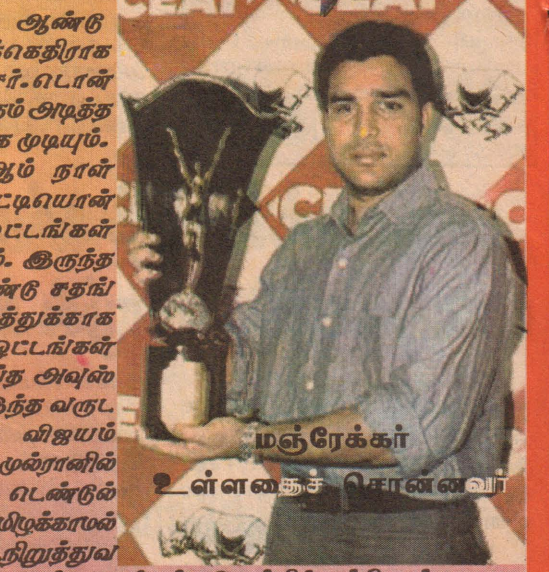
மஞ்சேக்கர் உள்ளகைச் சொன்னவர்