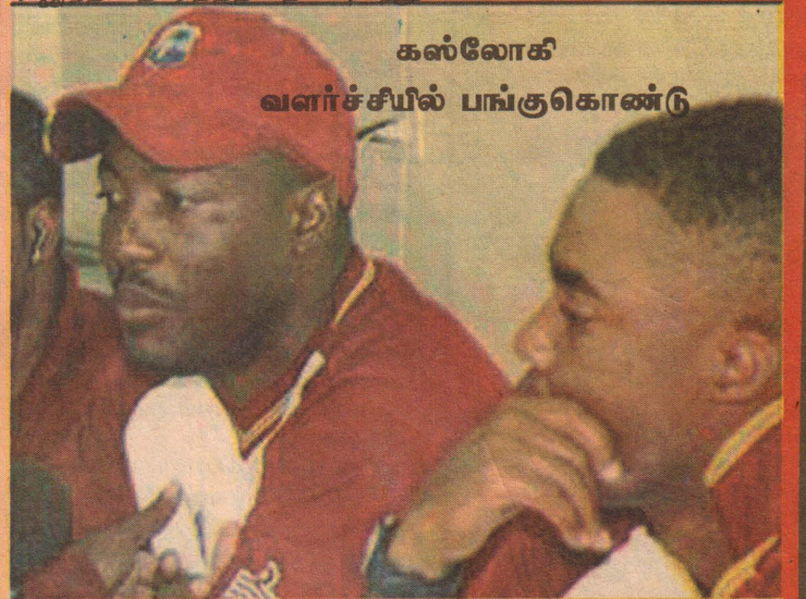
கஸ்லோவி வளர்ச்சியில் பங்குகொண்டு