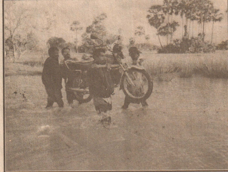
கிளிநொச்சி - பெரியகுளம் வீதிக்கு குறுக்காக வெள்ளம் பாய்வதையும், இந்த வீதியை கடப்பதற்கு மோட்டார் சைக்கிளை தூக்கிச் செல்வதையும் படத்தில் காணலாம்.