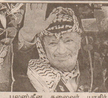
பலஸ்தீன தலைவர் யாசீர் அரபாத் இறந்த பிறகு, அவர் உடலை எங்கே புதைப்பது என்பதில் இஸ்ரேலுடன் பலஸ்தீனர்களுக்கு உடன்பாடு ஏற்பட்டது.

ஜெருசலேம் நகரில் அரபாத் உடலைப் புதைப்பதற்கு அனுமதிக்கமாட்டோம் என்று இஸ்ரேல் அறிவித்துவிட்டது. இதனால் அரபாத் உடலை எங்கே புதைப்பது என்பதும் பெரிய சர்ச்சையானது.