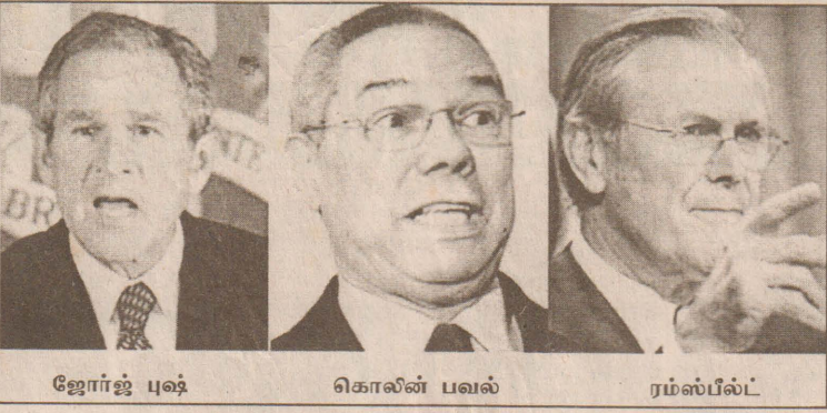
ஜோர்ஜ் புஷ் கொலின் பவல் ரம்ஸ்பீல்ட்

தெரிவிக்கின்றன. ரம்ஸ்பீல்டுக்கு பதிலாக தற்போது இராணுவத்துணை அமைச்சராக இருந்துவரும் பால் உட்போவிட்ஸ், இராணுவ அமைச்சராக கப்பலாம் என்று கருதப்படுகிறது. எனினும் ஈரக்கில் சோதனையிட்டு பேரழிவு ஆயுதங்களை கைப்பற்ற முடியாமல் போனதால் பால் உட்போவிட்ஸ் மீது செனட் சபை அதிருப்தியில் உள்ளது.