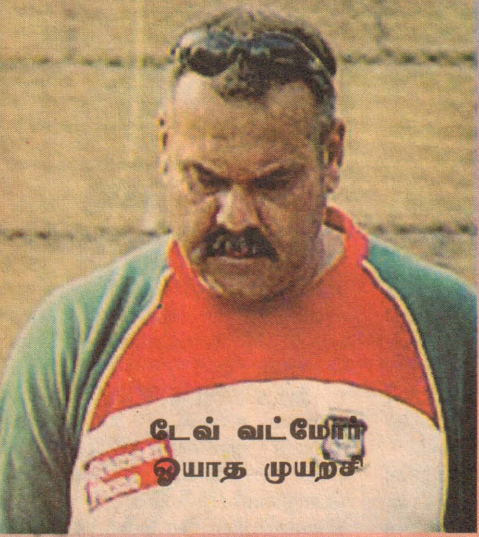
டேவ் வட்மோர் ஓயாத முயற்சி