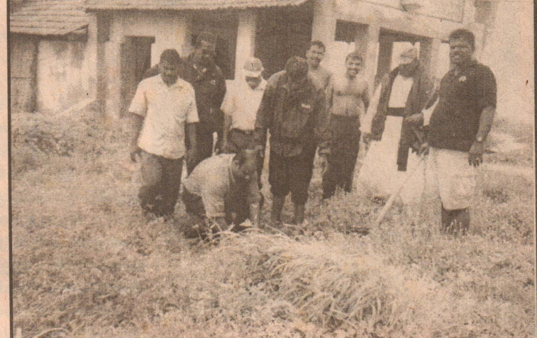
கச்சத்துப் பகுதியில் 2000 பணம் விதைகள் நாட்டச் சென்றபோது, சம்பிரதாயுர்வமாக நெடுந்தீவு உதவி அரசாங்க அதிபர் ம.பற்றிக் டிரஞ்சன் முதல் பணம் விதையை நடுகின்றார். (113)