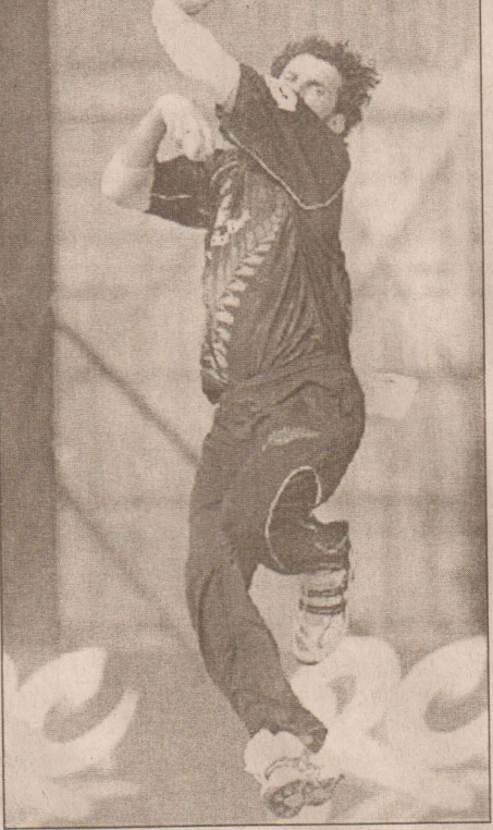
இதன் மூலம் 3 விக்கெட் வித்தியாசத்தில் பங்களாதேஷை வீழ்த்திய நியூசிலாந்து 2:0 என்ற முன்னிலையில் ஒருநாள் தொடரையும் கைப்பற்றியது.

நியூசிலாந்து அணி 2:0 என்ற முன்னிலையில் கைப்பற்றியது. இந்த நிலையில் சொந்த மண்ணில் ஒருநாள் தொடரையாவது கைப்பற்றும் நோக்கத்துடன் களமிறங்கியது பங்களாதேஷ். ஆனால், முதல் போட்டியிலேயே தோல்வி அடைந்தது. இரண்டாவது போட்டி டாக்காவில் நேற்று முன்தினம் நடைபெற்றது. இதிலும் பங்களாதேஷ் அணியின் மோசமான ஆட்டம் தொடர்ந்தது. இந்த அணி 43.4 ஓவர்களில் அனைத்து விக்கெட்டையும் இழந்து 146 ஓட்டங்கள் மட்டுமே எடுத்தது. காலித் மகுத் அதிகபட்சமாக 41 ஓட்டங்கள் எடுத்தார். நியூசிலாந்து தரப்பில் ஸ்ரைரிஸ் 3, மில்ஸ் 2, பிராங்கிளின் 2, கெய்ன்ஸ் 2, விக்ரோதி 1 விக்கெட் வீழ்த்தினார். இதன் பின்னர் நியூசிலாந்து அணி ஆட்டத்தை ஆரம்பித்தது. இதில் சின்கிளையர், அஸ்ரில் ஜோடி அபாரமாக ஆடியது. இந்த ஜோடி 74 ஓட்டங்கள் சேர்த்த நிலையில் - அஸ்ரில் (29) ஓட்டங்களுடன் அகமதின் பந்தில் வெளியேறினார். இவரைத் தொடர்ந்து மார்ஷல் (2), ஸ்ரைரிஸ் (12), மக்மிலன் (7), மெக்கல்லம் (0) ஆகியோரையும் அகமது வீழ்த்தி, முதன்முறையாக ஐந்து விக்கெட் கைப்பற்றினார். விரைவில் முக்கிய விக்கெட்டுக்களை இழந்த நியூசிலாந்து அணிக்கு சின்கிளையர் அரைச்சதம் அடித்து நம்பிக்கை தந்தார். இவர் 62 ஓட்டங்களில் வெளியேறினார். இறுதியில் நியூசிலாந்து அணி 44.4 ஓவர்களில் 7 விக்கெட் இழப்புக்கு 148 ஓட்டங்களை எடுத்தது.