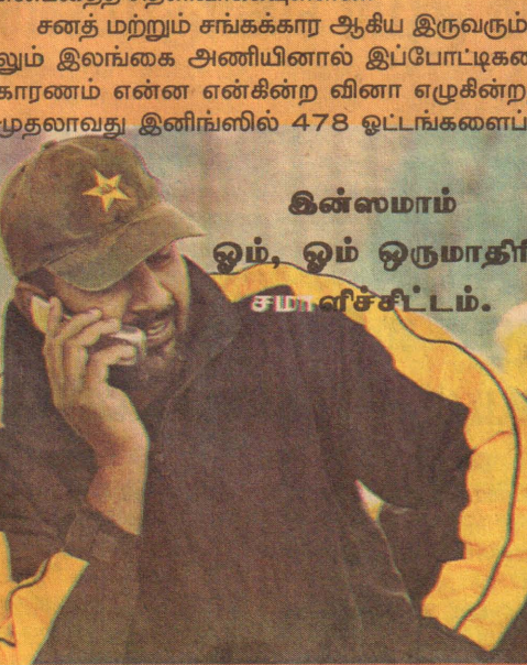
இன்ஸமாம் ஓம், ஓம் ஒருமாதிரி சமாளிச்சிட்டம்.

பாகிஸ்தான் அணிக்கெதிராக கராச்சியில் இடம்பெற்ற இரண்டாவது டெஸ்ட் போட்டியிலும் வெற்றி பெற்று இலங்கை அணி ஹற்றிக் சாதனை படைக்கும் என அனைவராலும் எதிர்பார்க்கப்பட்டது. ஆனால் தம்முடைய கோட்டையான கராச்சியில் எந்த அணியும் தம்மை வென்றுவிட முடியாது என்பதனை மீண்டும் நிரூபித்துக்காட்டியுள்ளது பாகிஸ்தான் அணி. பைசாலாபாத்தில் இடம்பெற்ற முதல்நாள் டெஸ்ட் போட்டியில் பாகிஸ்தான் அணியை 201 ஓட்டங்களால் தோற்கடித்த இலங்கை அணி, கராச்சியில் இடம்பெற்ற டெஸ்ட் போட்டியில் 6 விகிதெடுக்களால் தோல்வியைத் தழுவிக் கொண்டமையானது. இலங்கை அணி வீரர்களிடம் வளர்த்தெடுக்கப்பட வேண்டிய சில திறமைகள் இன்னும் இருக்கின்றன என்பதைத் தெளிவாக்கியுள்ளன.