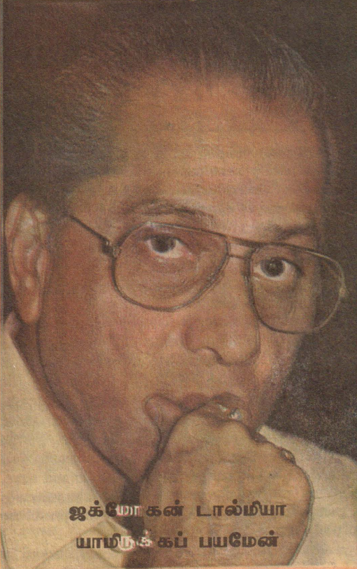
ஜகமோகன் டால்மியா யாமிருக்கப் பயமேன்

25 வருடகாலமாக தண்ணிகாட்டிய சந்தனக் கடத்தல் வீரப்பனை, அவரது இடத்திலேயே வைத்துக் கொண்டு அவரின் ஆதிக்கத்தை முடிவுக்குக் கொண்டுவந்த இந்திய அதிரடிப்படையினர் போன்று, 35 வருடகாலமாக சொந்தமண்ணில் போக்குக்காட்டிய இந்திய அணியினரை வீழ்த்தி, தமது கிண்ணக் கனவை நனவாக்கியுள்ளனர் அவுஸ்ரேலிய அணியினர்.