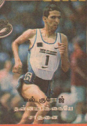
எல் குறோஜ் தன்னகத்தே சாதனை

எல்குறோஜ் 1500 மீற்றர், 2000 மீற்றர் உலக சாதனை நேரத்தைத் தன்னகத்தே கொண்டிருப்பவர். இப்பொழுது அவரது நோக்கம் 2005 ஆம் ஆண்டில் தற்போது கெனனிஸா பிக்கெலே தன்னகத்தே