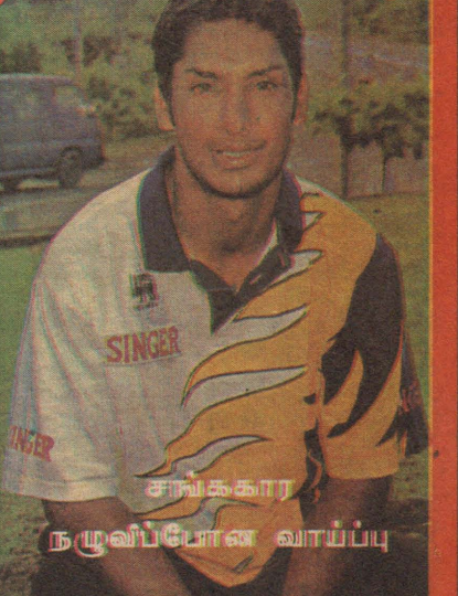
சங்கக்கார நடுவப்போன வாய்ப்பு