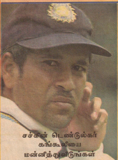
சச்சின் டெண்டுல்கர் கங்கூலியை மன்னித்துவிடுங்கள்

நாக்பூரில் நடைபெற்ற இந்திய - அவுஸ்ரேலிய அணிகளுக்கு இடையிலான மூன்றாவது டெஸ்ட் போட்டியில் வென்று, தொடரைக் கைப்பற்றியதன் மூலம் அவன் போடர். மார்க் டூயல் - ஸீவ்வோ போன்ற கிரிக்கெட் ஜாம்பவான் களாலேயே முடியாத காரியத்தை கில்கிழிஸ்ட் தல்லைமையிலான அணியினர் சாதித்துக் காட்டியுள்ளனர்.