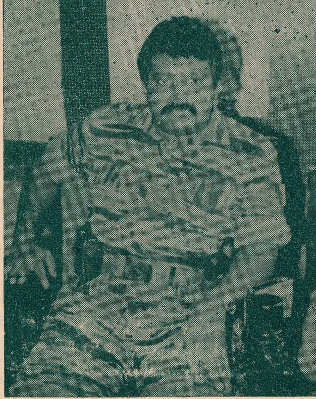
தமிழீழத் தேசியத்தலைவர் திரு. வே. பிரபாகரன் அவர்கள்

எனது அன்பிற்கும் மதிப்புக்குமுரிய தமிழீழ மக்களே!