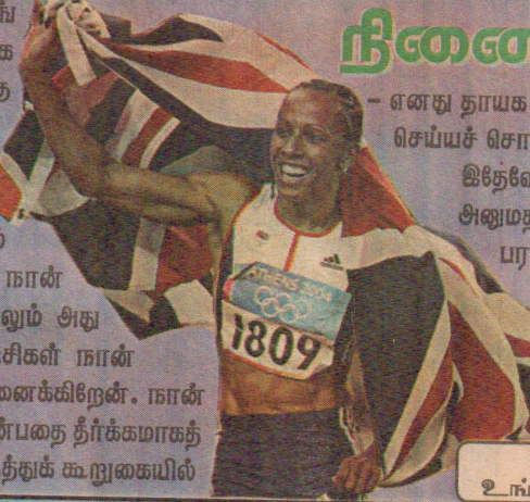
கெலி ஹோம்ஸ் உங்கள் மீது எங்கள் பார்வை

ஒலிம்பிக் இரட்டைத் தங்க வீராங்கனை கெலி ஹோம்ஸ் பேர்மிங் ஹம் உள்ளகத் தடகனப்போட்டிகளில் 1000 மீற்றர் ஒட்டத்தில் மிக இலகுவாக வெற்றியைக் கண்டிருக்கிறார். முப்பத்தினார்கு வயதாகும் கெலி ஹோம்ஸ் இரண்டு நிமிடம் 35.39 செக்கன்களில் தனது வெற்றி இலக்கை அடைந்துள்ளார். ஆனால் இதைவிட முக்கியத்துவம் வாய்ந்த தடகனப் போட்டிகள் அடுத்த மாதம் நான்காம் திகதி முதல் ஆறாம் திகதி வரை ஸ்பானியாவில் நடைபெறவுள்ளன. அது ஐரோப்பிய சம்பியன்ஷிப் போட்டிகள். நான் இந்தப்போட்டிகளில் கலங்குகொள்ள விண்ணப்பிப்பேன் என்றாலும் அது இறுதிநேர முடிவாகத்தான் இருக்கும். ஏனெனில் எனது பயிற்சிகள் நான் நினைத்த அளவுக்குத் திருப்திகரமாக அமைய வில்லை என்றே நினைக்கிறேன். நான் ஆறுதலாக யோசிக்கு வேண்டும். நான் என்ன செய்யப்போகிறேன் என்பதைத் தீர்க்கமாகத் தீர்மானிக்க வேண்டும் என்பவர், பேர்மிங்ஹம் வெற்றிப்பற்றிக் கருத்துக் கூறுகையில்