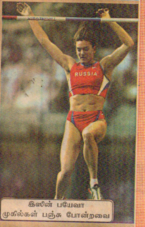
இரன் பையெவா முகில்கள் பஞ்சு போன்றவை