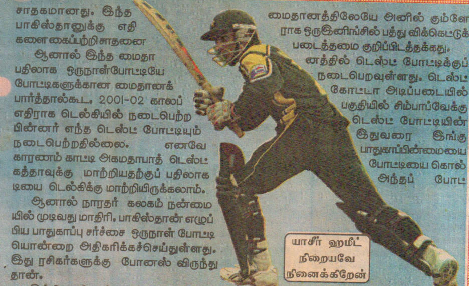
யாசீர் ஹமீட் நிறையவே நினைக்கிறேன்

இதில் கொல்கத்தாவை பொறுத்தவரை பாகிஸ்தான் கடைசியாக 1999ஆம் ஆண்டு சுற்றுப்பயணம் மேற்கொண்டு விளையாடிய டெஸ்ட் போட்டியிலும்சரி, இந்திய கிரிக்கெட் சபையின் பவளவிழா ஒருநாள்போட்டியிலும்சரி இந்தியா தோல்வியே அடைந்திருந்தது. இந்திய ரசிகர்களைப் பொறுத்த வரையில் கொல்கத்தாவில் இந்தியா பாகிஸ்தானை சந்திப்பதை விடும்பமாட்டார்கள். இந்தவகையில் டெல்கி பெரோஷா கோடலா மைதானம் இந்தியாவுக்குச்