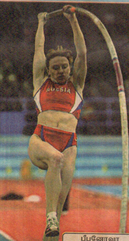
பீப்னோவா மேகம் குளிகிறகு