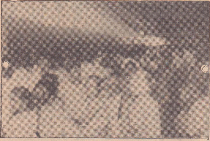
ஒன்றரை வருட காலத்தின்பின்னர் யாழ்ப்பாணம் பெருந்தொகையான பயணிகளில் ஒரு பகுதியினரையே இங்கு நீங்கள் பார்க்கிறீர்கள்.