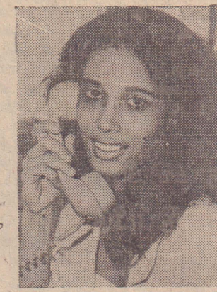
'குறைந்தபட்ச வைப்புத் தொகை ரூ.1000/- மட்டுமே. அத்துடன் மிகச் சிறிய முதலீட்டாளர்களுக்கும் மிகக் கண்ணியமான சேவை'