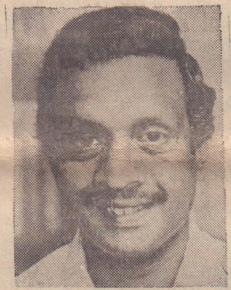
'கால நூற்றாண்டுக்கும் மேலாக அவர்களால் நிரூபிக்கப்பட்ட நம்பிக்கையான சேவை'