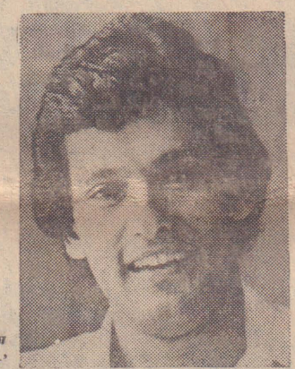
'தொடர்ச்சியான சிறந்த வட்டி வீதங்கள்'