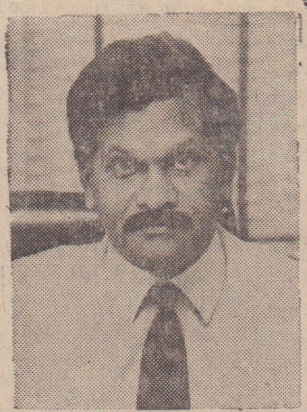
'வைப்பு ஆதாரத்தில் 40%க்கும் மேற்பட்ட தொகைக்கு நிறைகாப்பு.'