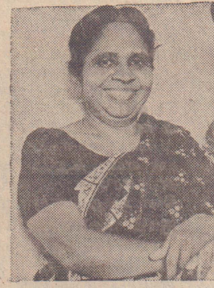
'எனது முதலீடுகளுக்கும் பாதுகாப்பும் எனக்கு உறுதியான வருமானமும்'