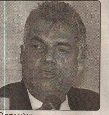
கொழும்பு ஐ.தே.கட்சியின் தலைமைப் பொறுப்பிலிருந்து ரணில் விக்கிரமசிங்க எதிர்வரும் 6ஆம் திகதி விலகவேண்டுமென அந்தக் கட்சியின் பெருமளவான நாடாளுமன்ற உறுப்பினர்கள் நிபந்தனை விதித்துள்ளனர்.