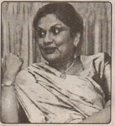
கிடைக்கவில்லை என்றும், தாங்கள் வெளியிட்ட செய்தி உண்மை தான் என்றும் ஈவினிங் ஸ்டாண்டர்ட் நிர்வாகம் தெரிவித்துள்ளது. இந்தச் சர்ச்சை தொடர்பாக இங்கிலாந்து அரசியாளின் பக்கிங்காம் அரண்மனைத் தரப்பிலிருந்து எந்தவித கருத்தும் தெரிவிக்கப்படவில்லை.

தச் செய்தியில் கூறப்பட்டுள்ளது. பிரிஸ்டல் பல்கலைக்கழகத்தில் கால்நடை மருத்துவராகத் தெரிவாகியிருக்கும் தன் மகனாக காக லண்டனுக்கு அருகில் ஒரு வீட்டை வாங்கியிருப்பதாகவும், சந்திரிகாவின் மகள் இங்கிலாந்தில் மருத்துவராக இருப்பதாகவும் அந்தச் செய்தியில் மேலும் தெரிவிக்கப்பட்டிருந்தது. ஆனால் இந்தச் செய்தியை சந்திரிகாவின் அலுவலகம் மறுத்துள்ளது. சந்திரிகாவுக்குச் சொந்தமாக வெளிநாட்டில் எந்தச் சொத்துமில்லை என்றும், இந்தச் செய்தியை வெளியிட்ட பத்திரிகை மீது சட்டபூர்வ நடவடிக்கை மேற்கொள்ளப்படும் என்றும் சந்திரிகாவின் அலுவலக அறிக்கையில் தெரிவிக்கப்பட்டுள்ளது. இருப்பினும் சந்திரிகாவின் மறுப்பு அறிக்கை, சட்டபூர்வ நடவடிக்கை தொடர்பான தாக்கல் மனு எதுவும் தங்களுக்குக்