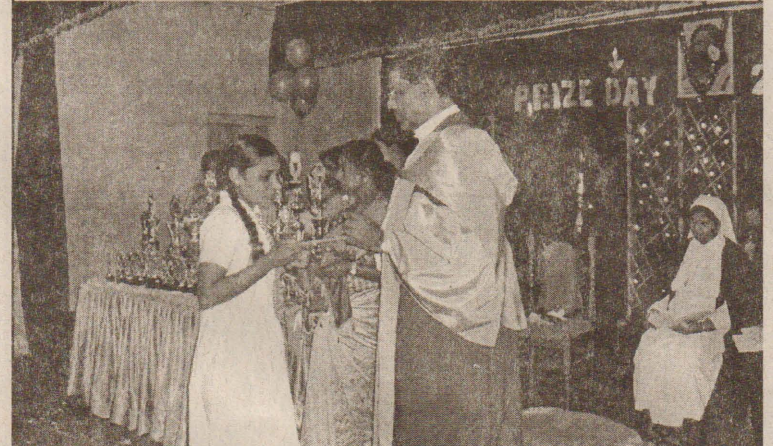
வவுனியா - அறம்பைக்குளம் மகளிர் மகாவித்தியாலயத்தின் வருடாந்த பரிசீலிப்பு விழா நிகழ்வில் சமாதானத்தை வலியுறுத்தி நிகழ்வில் கலந்து கொண்ட முக்கிய பிரமுகர்கள் ஒளியேற்றி பிரார்த்தனை செய்வதையும், பிரதம விருந்தினர் மாணவிக் ஒருவருக்கு பரிசில் வழங்குவதையும் படங்களில் காணலாம்.