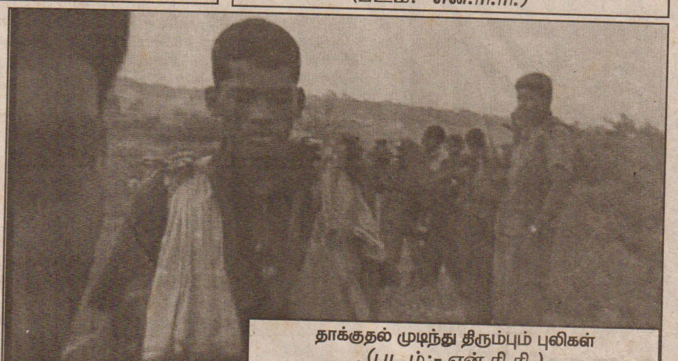
தாக்குதல் முடிந்து திரும்பும் புலிகள்