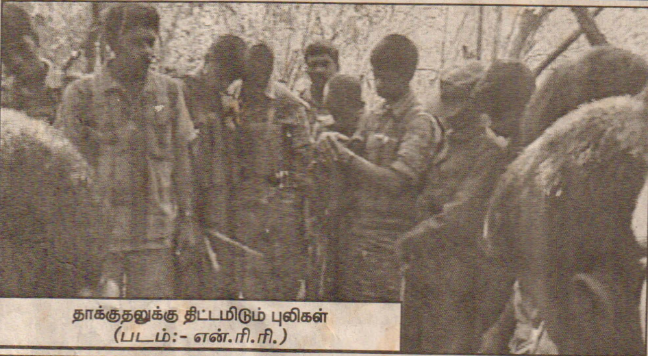
தாக்குதலுக்கு திட்டமிடும் புலிகள்