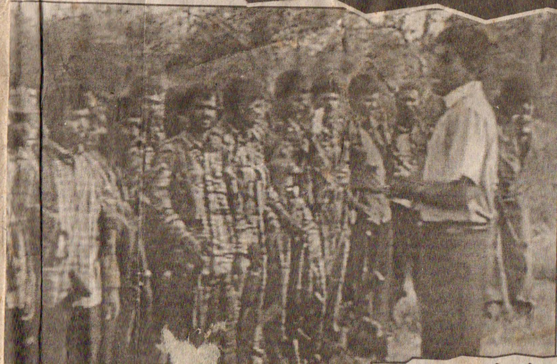
புக்கு தயாராகும் போராளிகள்

கருணாகுழு முகாம்கள் துவம்சம் 29 பேர் பலி - ஐவர் சிறைபிடிப்பு!