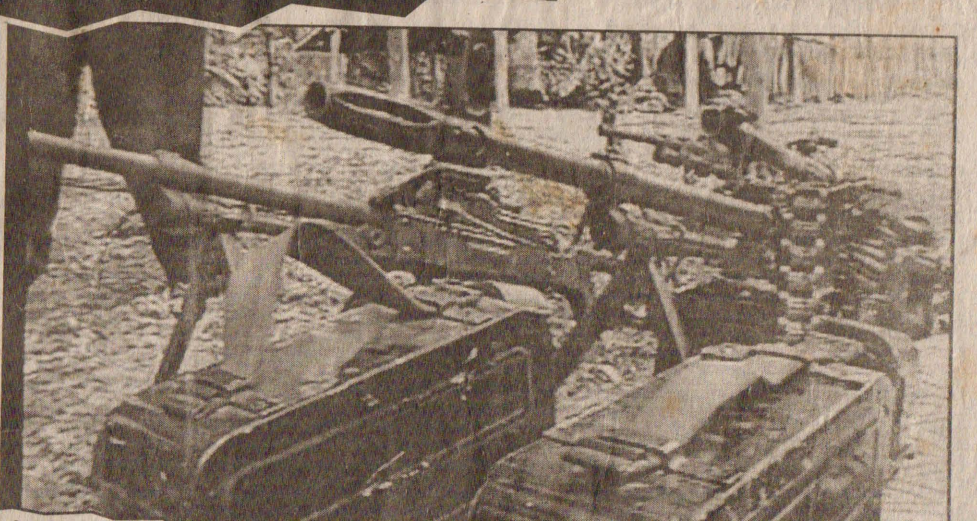
கைப்பற்றப்பட்ட ஆயுதங்களின் ஒரு பகுதி

யுவ மாவட்டத்திலுள்ள வெலிக் கத்தில் கருணாகுழுவினரின் புகளமீது விடுதலைப்புலிகளின் படையணியினரால் மேற் குத்துதலில்-கருணாகுழுவைச்