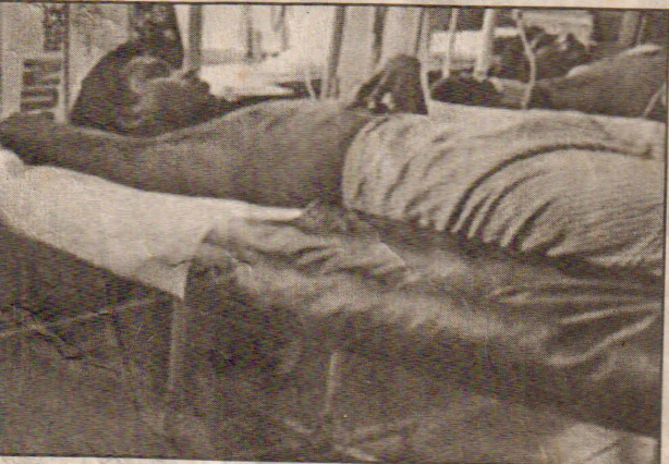
பொலநறுவ வைத்தியசாலையில் சிகிச்சைபெறும் கருணாகுழுவினர்.