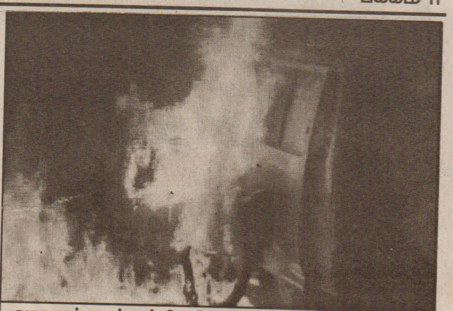
வாகனத்துடன் பற்றி எரியும் கருணாகுழு முகாம்