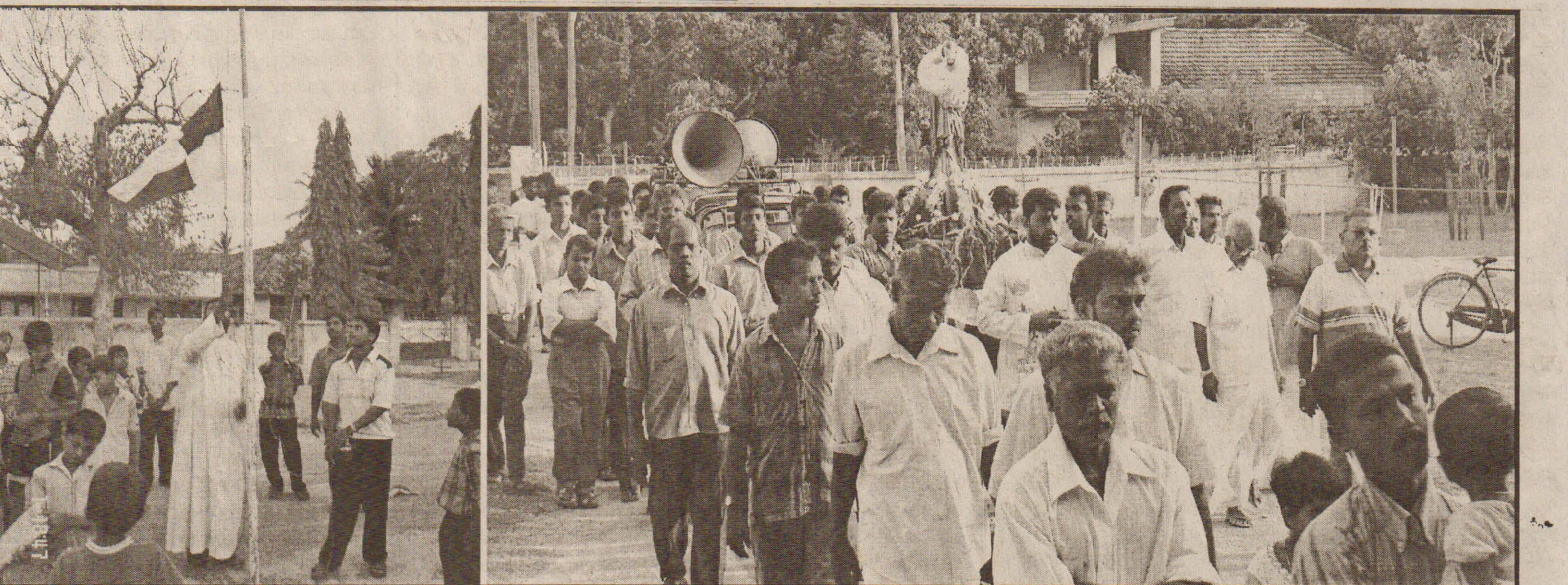
தொழிலாளர்களின் பாதுகாவலரான புனித சூசையப்பரின் திருவிழாவை முன்னிட்டு புனிதரின் திருச் சொலுபத்தை பவனியாக எடுத்து வருவதையும், வாலிபர் சங்கத்தினரால் ஒழுங்கு செய்யப்பட்ட விளையாட்டுப் போட்டியில் ஆலய பங்குத்தந்தை கொடியேற்றுவதையும் படங்களில் காணலாம். (சில்லை தாஸ்)

சாவகச்சேரி சாவகச்சேரி நகரசபையால் குடிநீர் விநியோகிக்கும் குடி நீர்க்குழாய்கள் சில விஷமிகளால் சேதப்படுத்தப்பட்டு வருவதால் நீர் விநியோகத்தை உரிய முறையில் செயற்படுத்த முடியாதிருப்பதாக நகரசபைச் செயலாளர் தெரிவித்தார். சாவகச்சேரிப் பகுதியில் 38 இடங்களில் குடிநீர் இல்லாத மக்களுக்கு குடிநீர் வசதி செய்து கொடுக்கப்பட்டுள்ளது. குறிப்பாக, 4 இடங்களில் தினமும் குழாய்களை சேதப்படுத்திவரும் கள். நீர் விநியோகத்துக்கு நிரந்தர