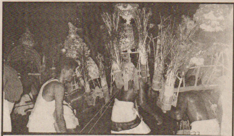
புளியம் - பொக்கணை நாகதம்பிரான் ஆலயத்தில் இடம் பெற்ற பொங்கல் விழாவின் போது பக்தர்கள் சாவடி எடுப்பதைப் படத்தில் காணலாம்.