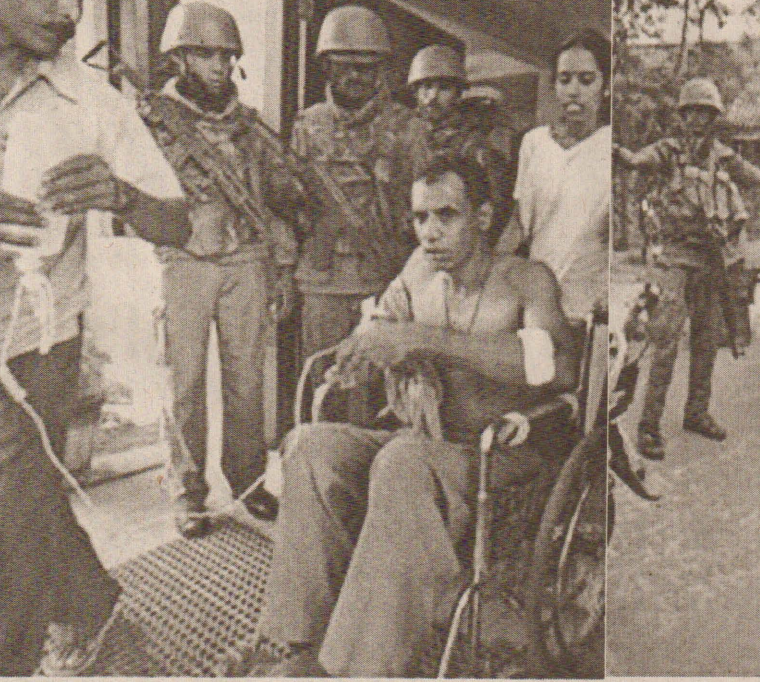
வவுனியா வைரவப் புளியாங்குளத்தில் நேற்று முன்தினம் பொலிஸார்பீது நடத்தப்பட்ட கிளைமோர் தாக்குதலில் காயமடைந்த பொலிஸாரை முதலாவது படத்திலும் - அதனைத் தொடர்ந்து பொதுமக்களை இராணுவத்தினர் சோதனையிடுவதையும் காணலாம்.

வாராந்த அமைச்சரவைக் கூட்டத்தில் விரிவாக கலந்துரையாடப்பட்டுள்ளது. எதிர்காலத்தில் இந்த விடயங்கள் வெளிச்செல்வதைத் தடுக்க உடனடி நடவடிக்கைகளை மேற்கொள்ள அமைச்சரவை தீர்மானித்துள்ளது. இந்த இரகசியத் தகவல்கள் வெளிநாடுகளுக்கும், ஊடகங்களுக்கும் செல்வது தேசிய பாதுகாப்புக்குப் பெரும் அச்சுறுத்தலென அமைச்சரவையில் வலியுறுத்தப்பட்டுள்ளது. (தே)