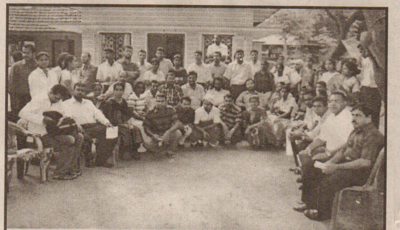
கொழும்பு - சமூக அபிவிருத்தி தேசிய நிறுவனத்தின் உளவளத் துணையாளர்கள் என்பது பேர் அண்மையில் யாழ்ப்பாணம் வந்தனர். போரினால் பாதிக்கப்பட்டவர்களின் உள நலன்களை அறியும் நோக்கத்துடன் கொழும்பில் இருந்த வந்த இவர்கள் யாழ்ப்பாண சுகவாழ்வு நிலைய உளவளத் துணையாளர்களுடன் இருப்பதைப் படத்தில் காணலாம்.

எனவே நாம் மீண்டும் துப்பாக்கிகள், பீரங்கிகள் என்பவற்றின் குறள்களின் வாயிலாகப் பேசவேண்டிய நிலையை அடைந்திருக்கிறோம். அவைகள் பேசும் மொழிதான் மற்றவர்களுக்கும் புரியுமென்றால் அவற்றின் மூலமே பேசுவோம் என மேலும் தெரிவித்தார். (09)