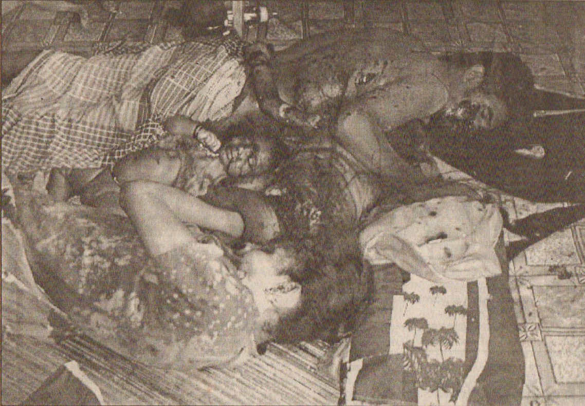
பச்சிளம் பாலகர்களோடு படுக்கையில் வைத்து சுட்டுத்தள்ளப்பட்ட குடும்பம்