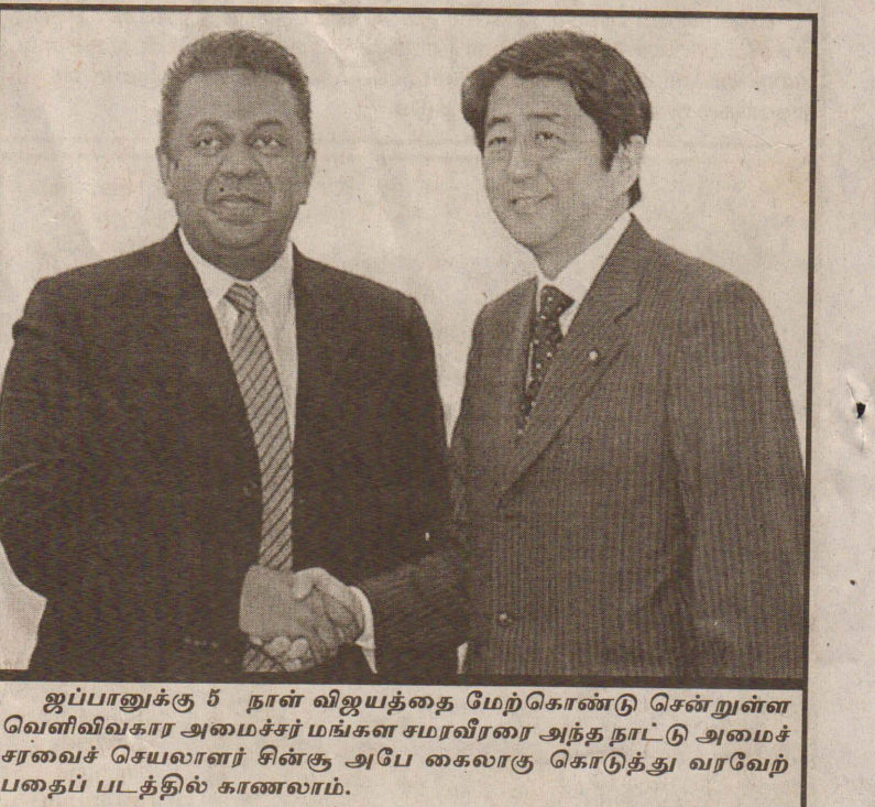
ஜப்பானுக்கு 5 நாள் விஜயத்தை மேற்கொண்டு சென்றுள்ள வெளிவிவகார அமைச்சர் மங்கள சமரவீரரை அந்த நாட்டு அமைச்சரவைச் செயலாளர் சிங்கு அபே கைலாகு கொடுத்து வரவேற்பதைப் படத்தில் காணலாம்.

இந்த ஆணைக்குழு விசாரணை மேற்கொண்டு மூன்று மாத காலத்துக்குள் அறிக்கை சமர்ப்பிக்கும் என ஜனாதிபதி செயலகம் தெரிவித்துள்ளது.