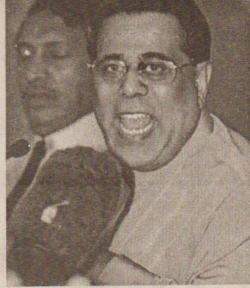
கள் பிரதி பொதுச் செயலாளர் உட்பட முக்கிய அதிகாரிகளுக்கு தெளிவுபடுத்தினார்.

கொழும்பு இனப்பிரச்சினைக்கு சகல இனங்களும் ஏற்றுக்கொள்ளக்கூடிய பேச்சுவார்த்தை மூலமான தீர்வை ஏற்படுத்த அரசாங்கம் அர்ப்பணிப்புடன் செயற்படுவதாக அமைச்சர் நிமால் சிறிபால டி சில்வா தெரிவித்தார். இதற்காக நேர்வாயின் அனுசரணையுடன் தமிழீழ விடுதலைப் புலிகளுடன் பேச்சுவார்த்தை நடத்தி வருவதாகவும் அவர் குறிப்பிட்டார். ஐக்கிய நாடுகள் சபையின் அரசியல் விவகார பிரதிச் செயலாளர் இப் ராஹிம் கம்ஹாரியுடனான சந்திப்பின் போதே அவர் இந்த விடயங்களைத் தெரிவித்தார். இலங்கையின் சமாதான முன்னெடுப்புகள் மற்றும் ஜெனிவா பேச்சுவார்த்தைகளின் எதிர்கால நடவடிக்கைகள் குறித்து இந்தச் சந்திப்பில் விரிவாக ஆராயப்பட்டது. இதேவேளை, தேசிய ரீதியில் ஒற்றுமையை ஏற்படுத்துவதன் மூலம் சமாதான செயற்பாடுகளை முன்னெடுத்துச் செல்வதற்காக ஜனாதிபதி மகிந்த ராஜபக்ஷ மேற்கொண்டுள்ள நடவடிக்கைகள் குறித்து அமைச்சர் நிமால் சிறிபால டி சில்வா ஐக்கிய நாடு