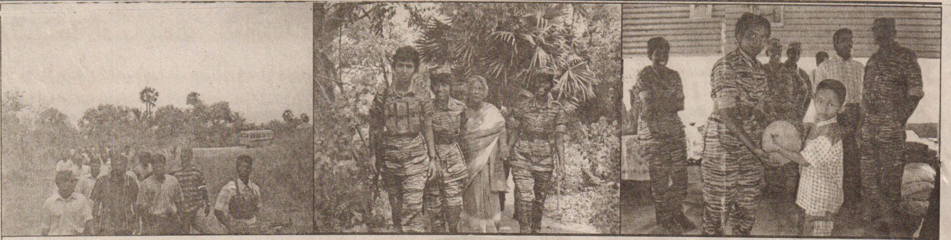
வன்னிப் பெருநிலப்பரப்பில் விடுதலைப்புலிகளின் முன்னரங்க களமுனைகளுக்கு நாள் தோறும் பெருமளவான பொதுமக்கள் சென்று ஆதரவு தெரிவித்து வருகின்றனர். அந்த வகையில் நேற்றுமுன்தினம் முகமாலை முன்னரங்கப் பகுதிகளுக்கு அக்கராயன் பிரதேச மக்கள் செல்வதையும், போராளிகளுடன் உரையாடுவதையும், உணவுப் பொருட்களை வழங்குவதையும் படங்களில் காணலாம்.