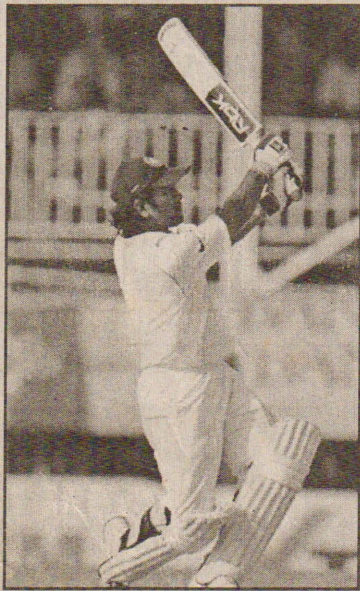
அன்டிசுவா - இந்திய - மேற்கிந்தியத்தீவுகள் அணிகளுக்கிடையே பரபரப்பாக நடைபெற்ற முதலாவது டெஸ்ட்

வீழ்த்தினர். 130 ஓட்டங்கள் பின்தங்கிய நிலையில் தொடர்ந்து தனது இரண்டாவது இனிங்ளை ஆரம்பித்த இந்திய அணி 6 விக்கெட் இழப்புக்கு 521 ஓட்டங்களைக் குவித்து ஆட்டத்தை இடைநிறுத்துவதாக அறிவித்தது. மிகச்சிறப்பாகத் துடுப்பெடுத்தாடிய ஜபார் 24 பவுண்டரிகள், ஒரு சிக்ஸர் அடங்கலாக 212 லேவாக் 41, கக்ஷமன் 31, ராவிட் 62, யுவராஜ் சிங் 39, டோனி 69 கைஃப் ஆட்டமிழக்காமல் 47 ஓட்டங்களைப் பெற்றனர். பந்துவீச்சில் மொகமட் 3, கொலிமோர், பிராட்ஷோ மற்றும் கெய்ல் தலா 1 விக்கெட்டை வீழ்த்தினர். பதினுக்கு 392 ஓட்டங்களைப் பெற்றால் வெற்றி என்ற நிலையில் தனது இரண்டாவது இனிங்ளை ஆரம்பித்த மேற்கிந்தியத்தீவுகள் அணி சார்பாக கெய்லும் கங்காவும் ஆரம்பத் துடுப்பாட்ட வீரர்களாகக் களமிறங்கினர். இருவரும் மிகவும் நீதானமாக ஆடி நல்ல அடித்தளமொன்றை இட்ட