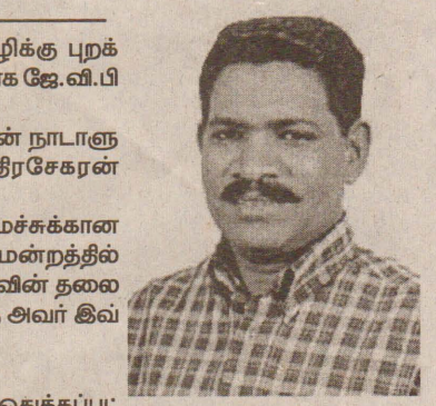
கொழும்பு அரசு ஊடகங்களில் தமிழ்மொழிக்கு புறக்கணிப்பு நிலை ஏற்படுத்தப்பட்டு வருவதாக ஜே.வி.பி குற்றம் சுமத்தியுள்ளார்.

கொழும்பு அரசு ஊடகங்களில் தமிழ்மொழிக்கு புறக்கணிப்பு நிலை ஏற்படுத்தப்பட்டு வருவதாக ஜே.வி.பி குற்றம் சுமத்தியுள்ளார். இந்தக் குற்றச்சாட்டை ஜே.வி.பியின் நாடாளுமன்ற உறுப்பினர் ராமலிங்கம் சந்திரசேகரன் முன்வைத்துள்ளார். தொலைத்தொடர்புகள் துறை அமைச்சுக்கான ஆலோசனைக்குழுக்கூட்டம் நாடாளுமன்றத்தில் அமைச்சர் அனூர பிரியதர்சன யாப்பாவின் தலைமையில் நடைபெற்றது. இதன் போதே அவர் இவ்வாறு தெரிவித்தார். அவர் மேலும் கூறுகையில் - தொலைக்காட்சியில் தமிழுக்காக ஒதுக்கப்பட்டுள்ள அலைவரிசையில் நிகழ்ச்சிகளுக்கான நேரங்களில் கிரிக்கெட் போட்டிகள் ஒலிபரப்பப்படுகிறது. வானொலியிலும், கேக்ஹவுஸ் நிறுவனத்திலும் இவ்வாறான புறக்கணிப்புகள் இடம்பெறுகின்றன என்றார். இதையடுத்து குறித்த விடயங்களில் உடனடி நடவடிக்கைகளை மேற்கொள்ளுமாறு அமைச்சர் உரிய அதிகாரிகளுக்கு உத்தரவிட்டதாகத் தெரிவிக்கப்படுகிறது.