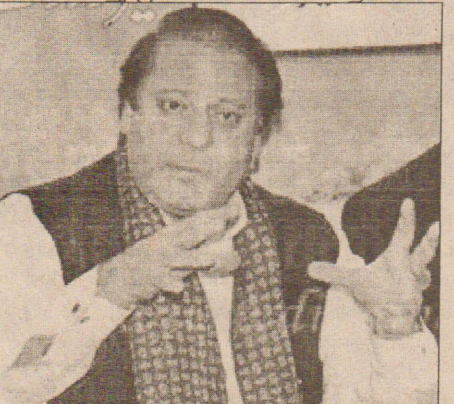
நவாஸ் ஷெரீப் அறிவித்து இருக்கிறார்.

பெனாசீரின் கட்சியான மக்கள் கட்சியில் பிளவு ஏற்பட்டாலோ அல்லது அதற்கு வெளியில் உள்ள சக்திகள் அதை உடைப்பதற்கு முயற்சி செய்தாலோ அதன் இணைத்தலைவர் சார்தாரிக்கு ஆதரவாக நான் இருப்போம் என்று முஸ்லிம் லீக் கட்சி தலைவர்