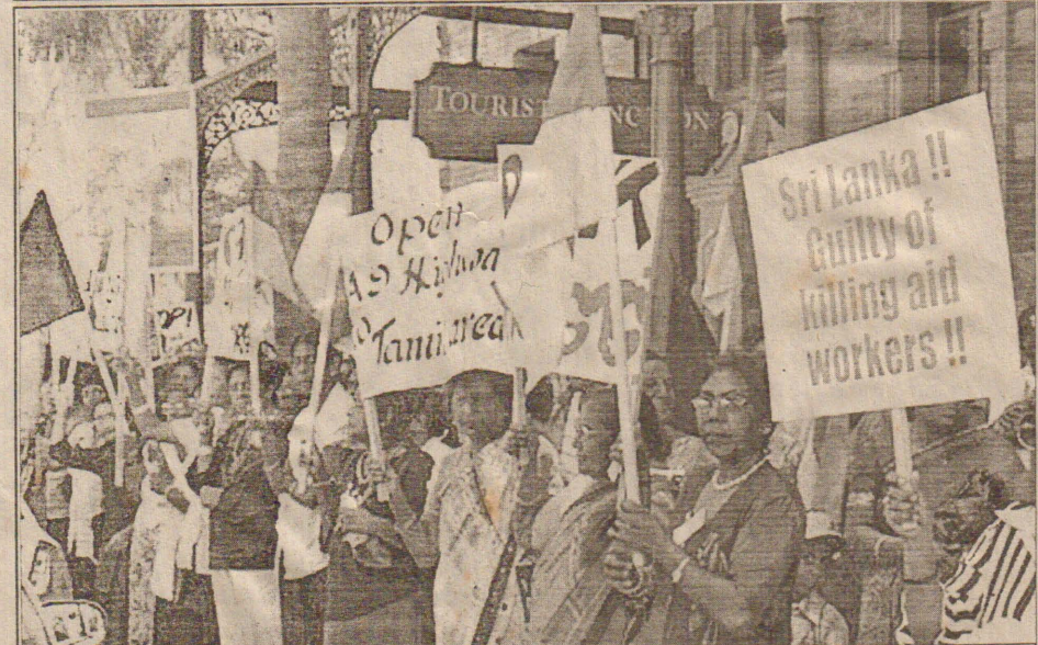
இலங்கைக்கான இந்திய ஆயுத உதவிகளைக் கண்டித்து தென்னாபிரிக்காவின் இந்தியத் தமிழர்கள் ஆர்ப்பாட்டத்தில் ஈடுபடுவதைப் படத்தில் காணலாம்.