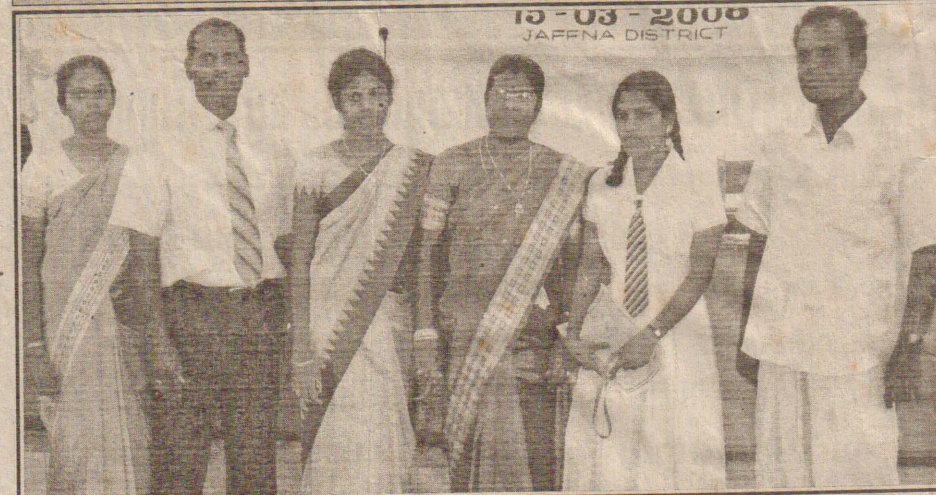
கரவெட்டி தேவரையாளி இந்துக் கல்லூரி மாணவி