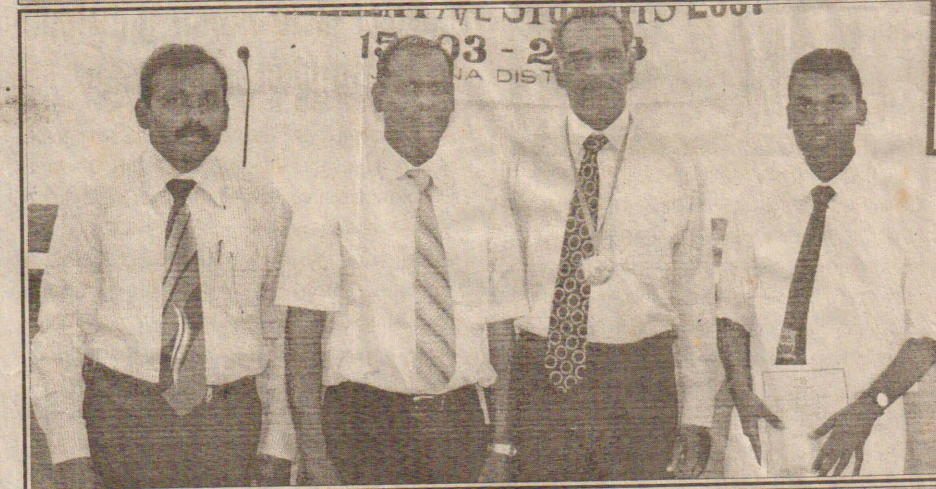
வேலாயுதம் மகா வித்தியாலய மாணவன்