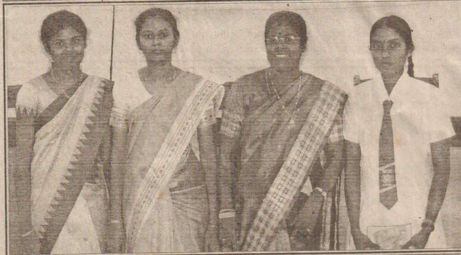
அளவெட்டி அருணோதயா கல்லூரி மாணவி