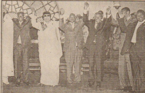
கடாபி தேசிய பள்ளிவாசல் திறப்பு விழாவில் கலந்துகொண்ட கென்யத் தலைவர் மாவெய் கிபாசி, விபியத் தலைவர் மும்மா கடாபி, உகண்டா தலைவர் யொவேரி முஸெவெனி, சோமாலியா தலைவர் அப்துல்லா யூசுப், றுவண்டா தலைவர் போல் சகமே மற்றும் புருண்டியின் தலைவர் பியர்ரே நகருன்சிசா ஆகியோரைப் படத்தில் காணலாம்.

விபிய தலைவரால் வைபவ ரீதியாக திறந்துவைக்கப்பட்ட இப் பள்ளிவாசலின் ஆரம்ப விழாவில் சுமார் 15,000 பேர் வரை கலந்து கொண்டனர்.