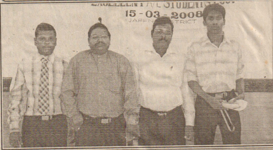
வடடு.இந்துக் கல்லூரி மாணவன்