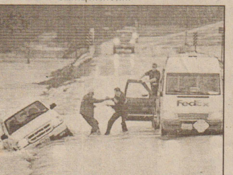
மின்னோடியில் அநேக நகர்களில் வரலாறு காணாத வெள்ளம் ஏற்பட்டுள்ளது. அங்கன் லாஸ், தென் இந்தியானா மற்றும் தென் மேற்கு ஒஹியோ மாநிலங்கள் வெள்ளத்தால் கடும் பாதிப்பை எதிர்கொண்டுள்ளன.

அமெரிக்க மாநிலங்களில் நிலவி வரும் கடும் மழையுடன் கூடிய சீரற்ற காலநிலை காரணமாக 13 பேர் பலியானதுடன் 3 பேர் காணாமல் போயுள்ளனர்.